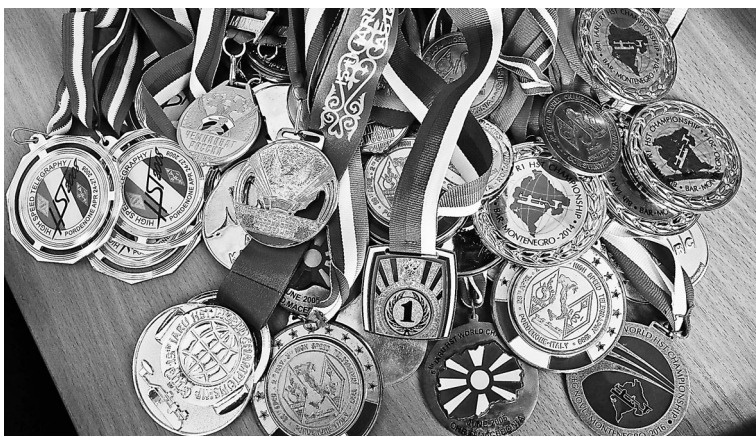
Чемпион показал корреспондентам «РГ» лишь часть медалей.