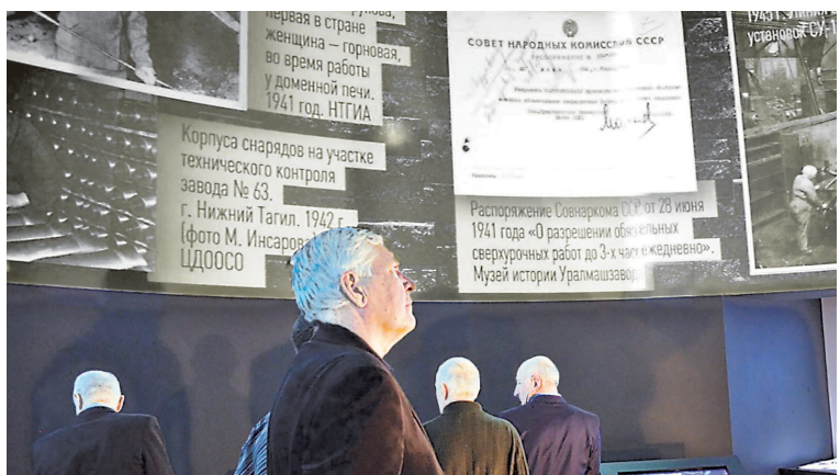
Мультимедийная экспозиция представляет документы масштабно и объемно.