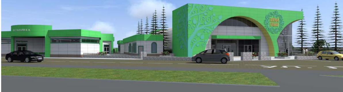
Вид с перекрестка улиц Ленина и Парковая