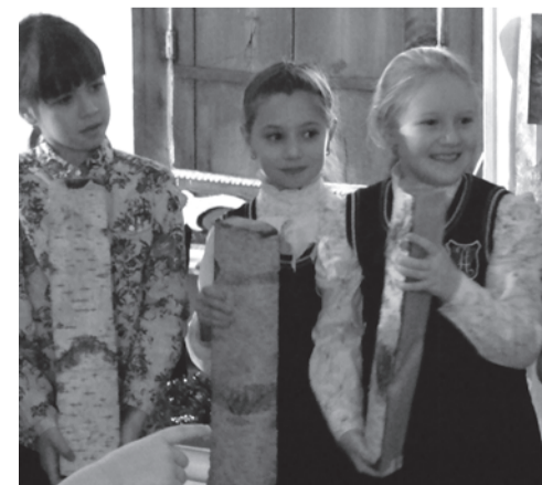
Гадаание на жениха