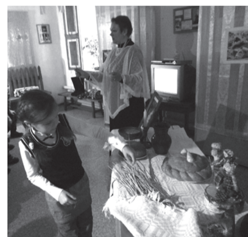
Гадаание на урожай