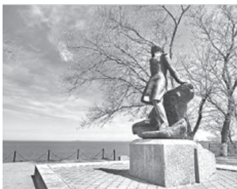
Памятник Лермонтову в Тамани

«Но я люблю – за что, не знаю сам – /Ее степей холодной молчанье,/Ее лесов безбрежных колыханье./Дубравы рек ее, подобные морям...»