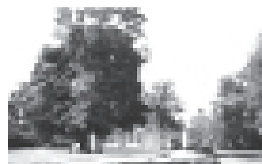
Тарханы. Имение бабушки Лермонтова