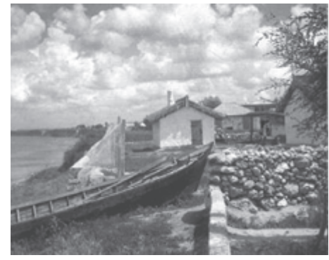
Дом в Тамани, где жил Лермонтов