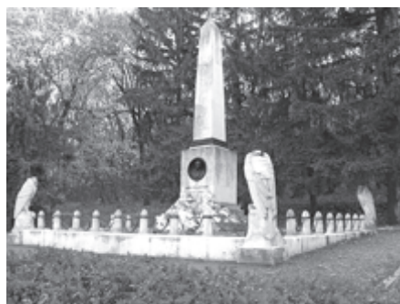
Пятигорск. Место дуэли Лермонтова

Чуть притомленные, переполненные впечатлениями, мы отдохнули в небольшом сквере возле памятника Лермонтову (скульптор А.М. Опекушин), сооруженного на народные средства в 1889 году. Высокий гранитный постамент. Лермонтов сидит, как будто опершись на скалу. Взгляд устремлен на могучие горы, а губы шепчут: «Как я любил твои бури, Кавказ...». Полюбили и мы. Посетили домик Лермонтова, музей его. Удалось даже подняться на гору Машук.