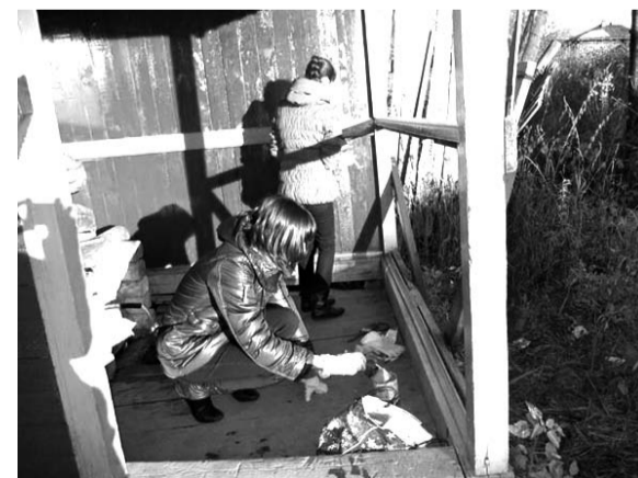
Шефство над родником по ул. им. 1 Мая в Верхней Салде