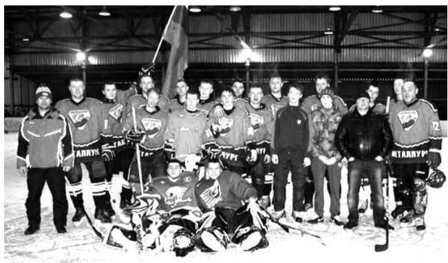
Команда "Металлург" сезона 2013-2014