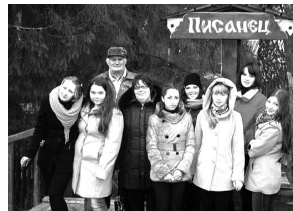
У колодца "Писанец" на Тагильском кордоне