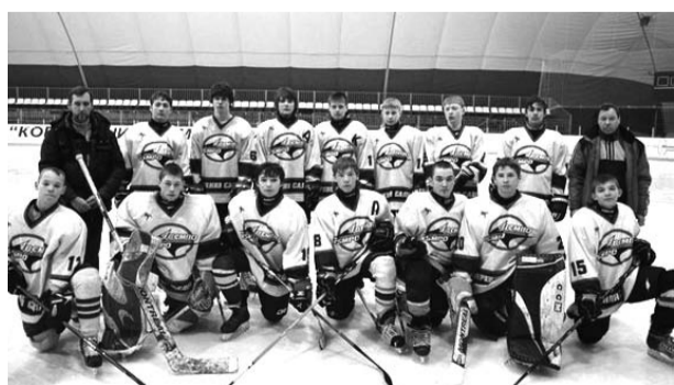
Игроки команды "Титан" 1997 года рождения