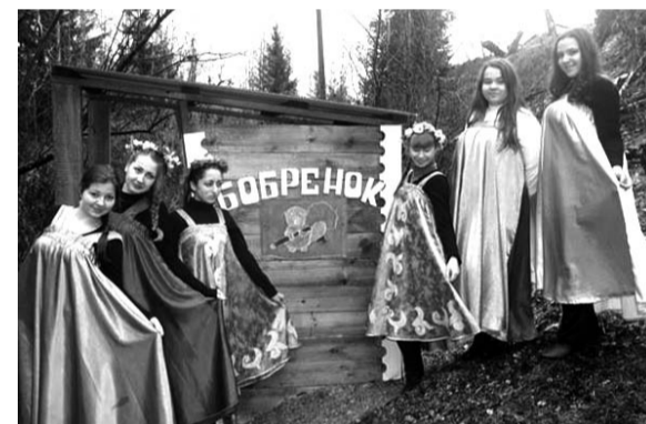
Открытие родника "Бобренок" в поселке Бобровка

Так что мы, жители, и сами хорошо «приложились», чтобы ухудшить экологическую обстановку в своем родном городе.