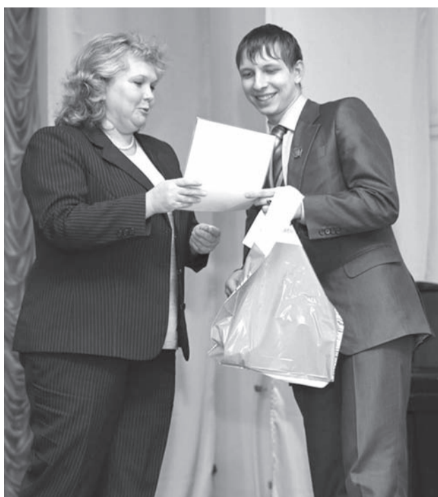
Вручение сертификата на получение стипендии