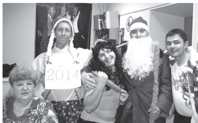
Водители в костюмах на вечеринке