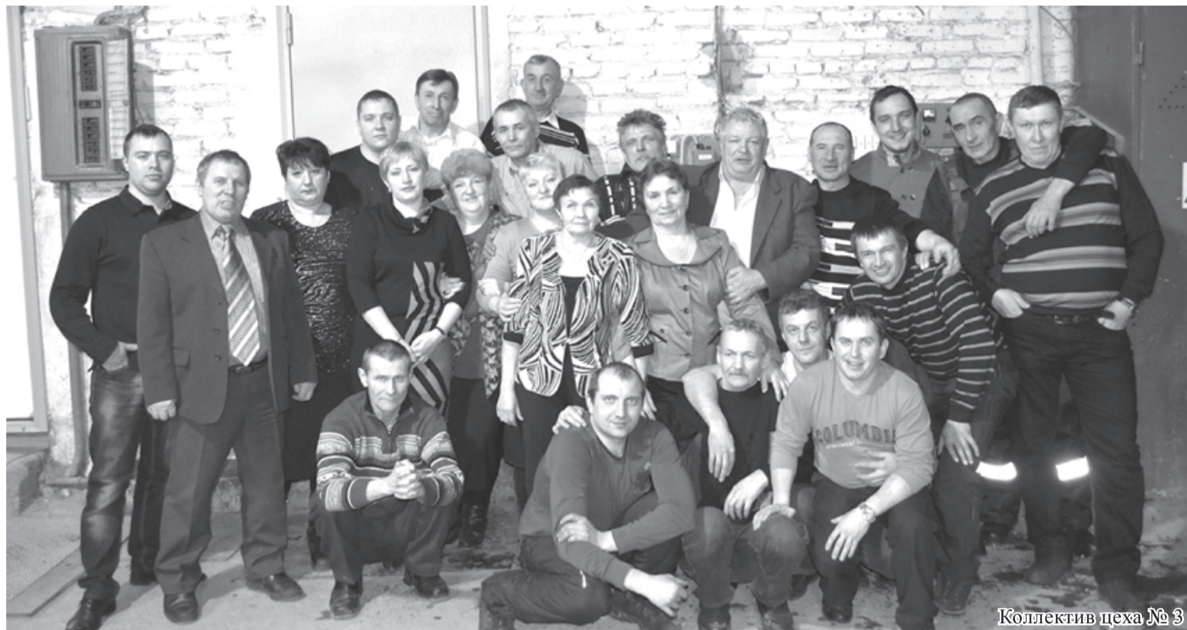
Коллектив цеха № 3