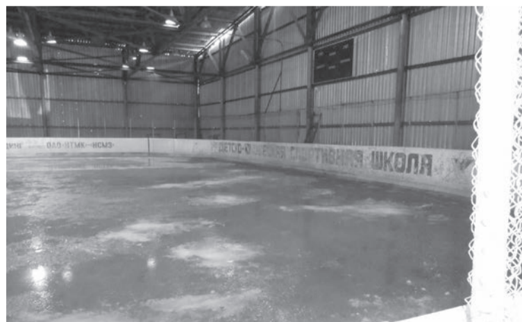
Первый лёд и табло