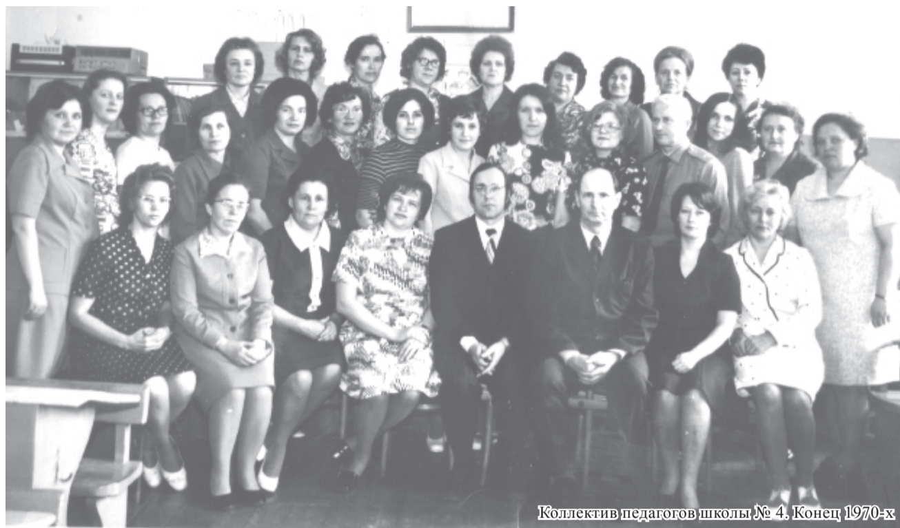
Коллектив педагогов школы № 4. Конец 1970-х