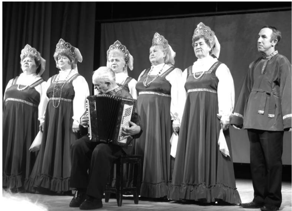
Ансамбль "Сударушки" порадовал патриотическими песнями