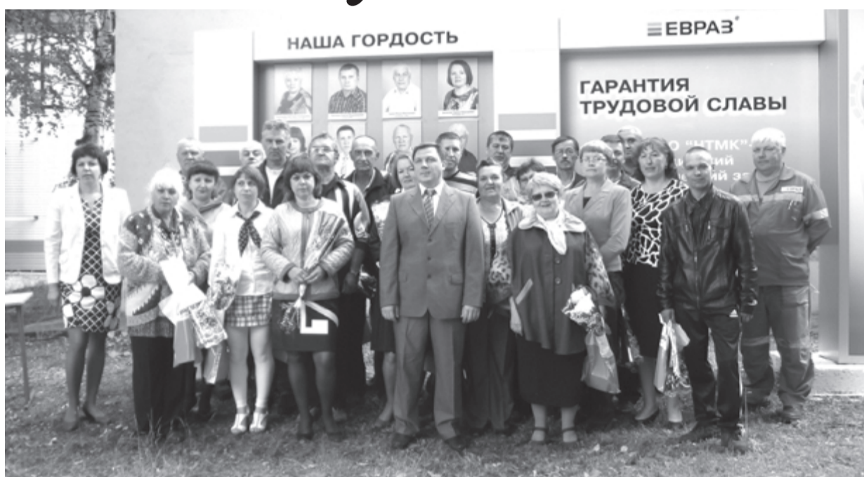
В день Металлурга. Июль 2014 г.

За последние дни эту роковую фразу услышали сотни работников старейшего металлургического предприятия Нижней Салды.