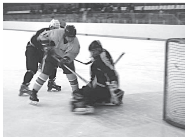
В атаке "Титан-2"