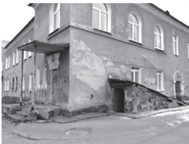
Терапевтическое отделение ЦГБ, г. Верхняя Салда, Россия

Собака - единственное существо, которое не предаст Вас ни в болезни, ни в старости, ни в опале