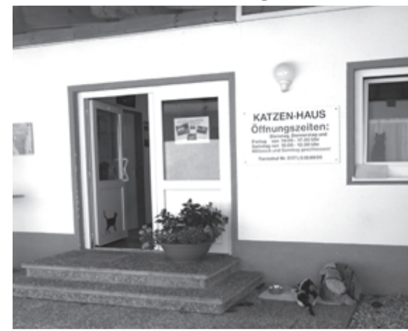
Приют для кошек, г. Фрайбург, Германия

«Развелось много собак!» - жалуются жители Верхней и Нижней Салды. К кому предъявлять претензии: к населению, собакам, властям?