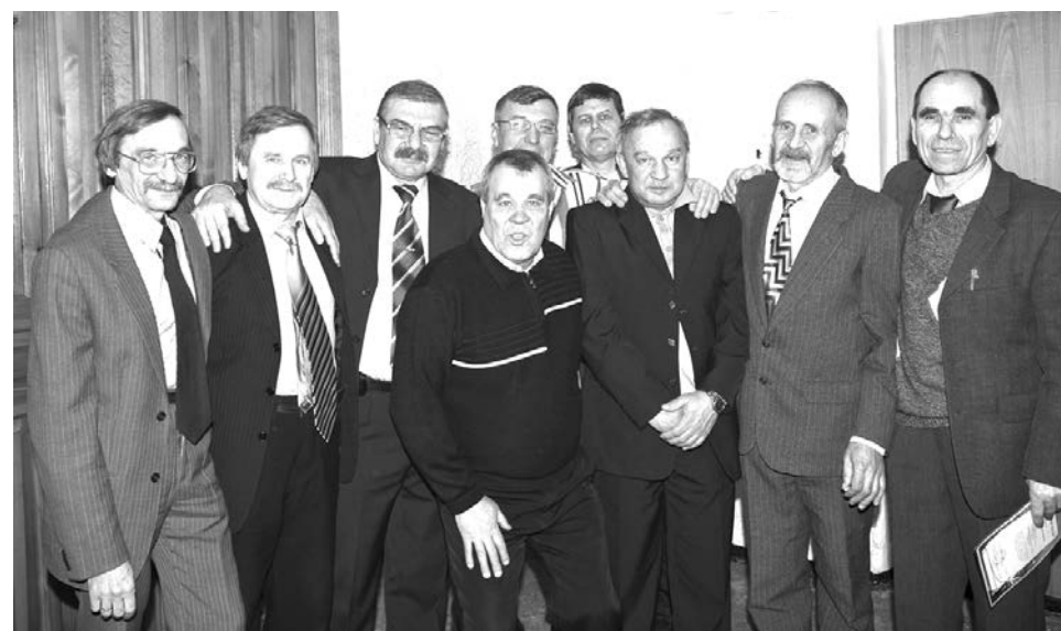
30 лет спустя