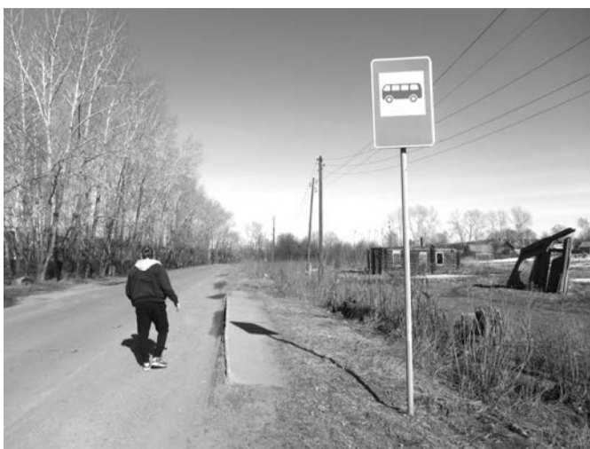
Улица Парижской коммуны, Нижняя Салда