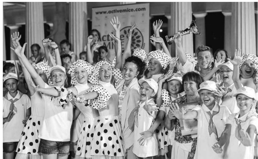
"Россияночка" - победители международного фестиваля