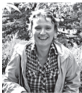
Рубрику ведет Марина Хвашчинская

Именно в вопросе о мульчировании важно представлять, для чего вам надо заниматься этим агроприемом