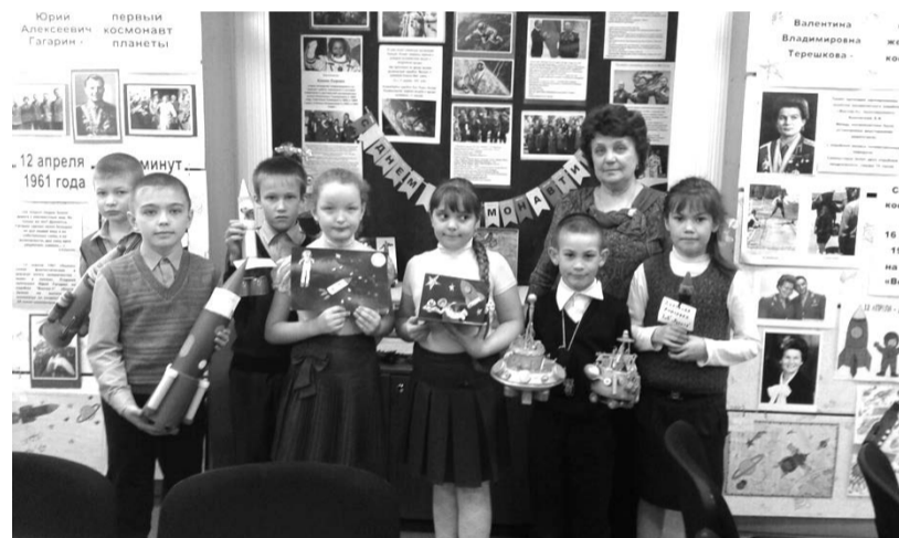
2Б и директор музея