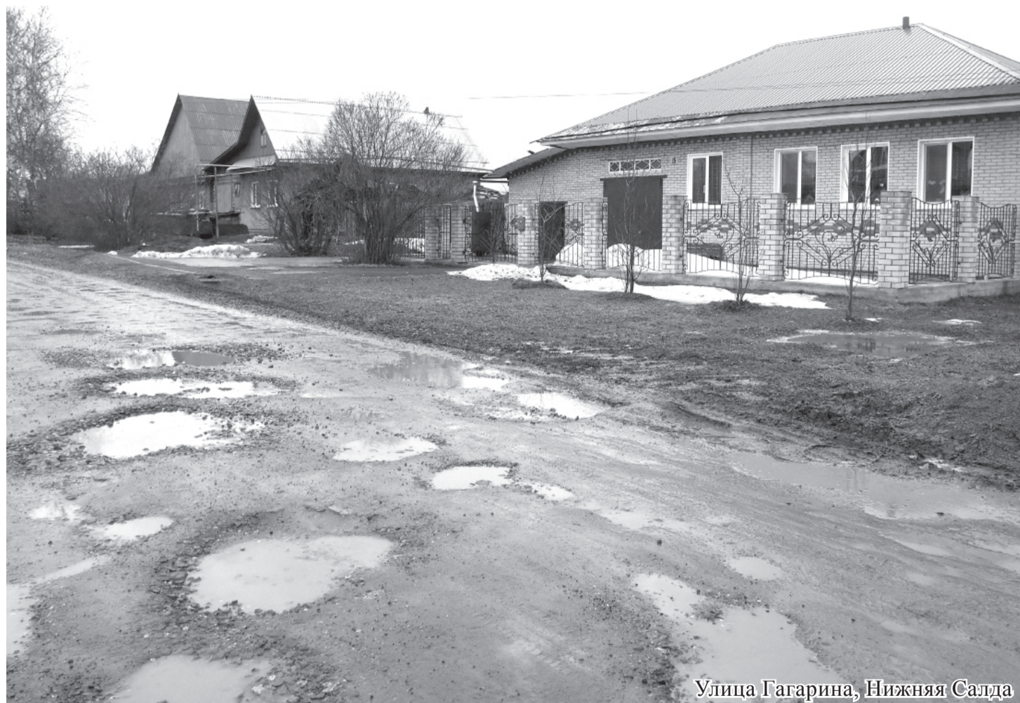
Улица Гагарина, Нижняя Салда