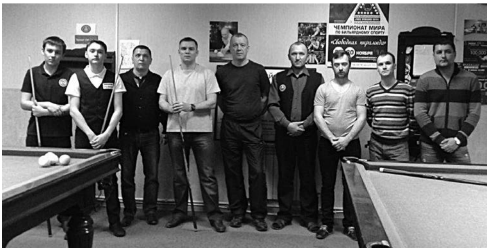
Участники первенства города по бильярду