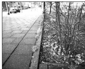
Нидерланды: земля находится ниже уровня бордюра