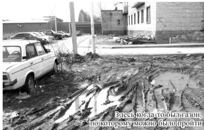
Здесь когда-то был газон, по которому можно было пройти

От земли – и спорить не нужно. Кто же помогает ей очутиться на газонах, тротуарах, обочинах, дорогах?