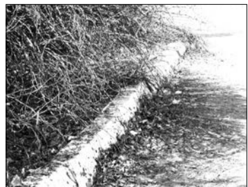
Россия, Нижняя Салда: земля находится выше уровня бордюра