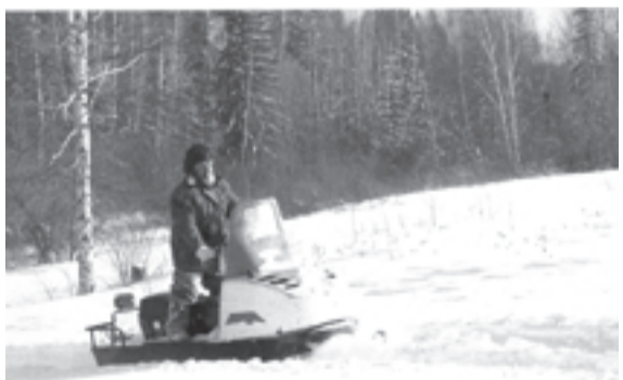
На зимнем учете зверей