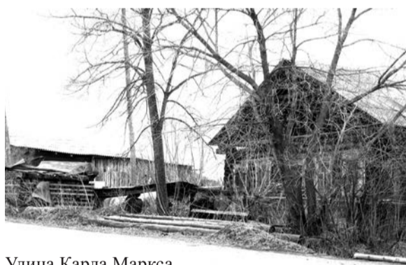
Улица Карла Маркса