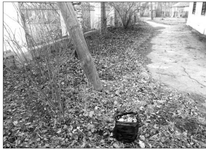
С этой территории собран вот такой небольшой легкий пакет с мусором. Листва осталась под березой, сиренью, акацией. Пусть растут здоровыми и сильными. Затраты: 10 минут, 1 человек.

А у них, в Европе, теперь бьются над такой проблемой: самые чистые на земном шаре немецкие леса, из которых десятилетиями выгребали весь растительный опад, умирают на корню. Потому что и почва стерилизовалась (там даже листва не гниет, потому как не то что червей, микроорганизмов не осталось, и птицы-звери убежали, и все биоразнообразие уничтожено).