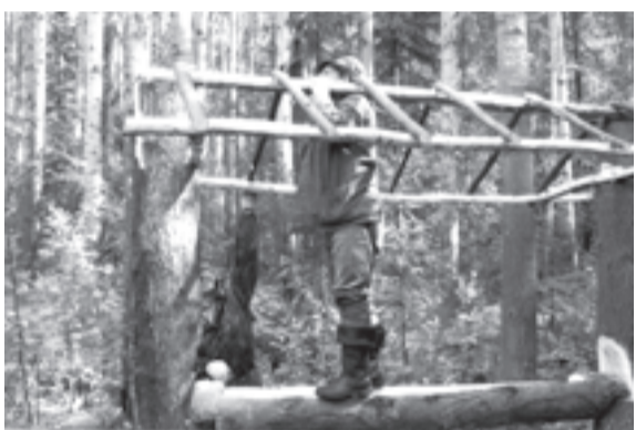
Изготовление солонцов для лесей