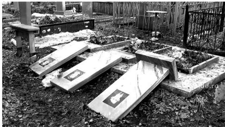
Фото и комментарии предоставлены владельцем сайта vsalde.ru Артемом Цепевым

14 апреля, накануне Родительского дня – Пасхи для усопших – на нижнесалдинском кладбище обнаружены вывороченные и опрокинутые памятники