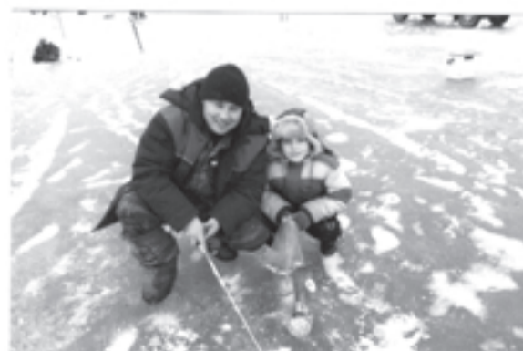
С папой на соревнованиях по рыбалке