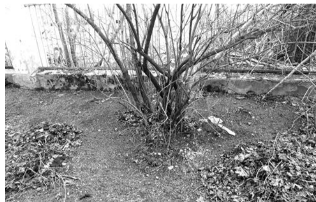
Дворники постарались - вычистили лист до земли. Кустарник остался без "пищи", а первый же дождь превратит землю в грязь

Увы, наши экологи даже не задумывались об этом. Для них уборка листвы, которую они считают мусором, – очевидное и обязательное мероприятие.