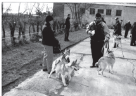
Выставка охотничьих собак. 2012 год