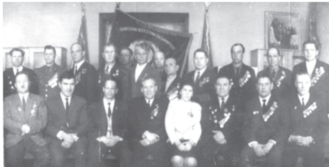
Ветераны и участники Великой Отечественной войны. НИИМаш, 1975 г.

Но считать пришлось 1418 дней, которые принесли нам многомиллионные жертвы самых мужественных и благородных людей, невероятные муки и страдания советских людей – от детей до стариков.