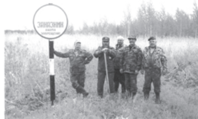
Остолбление границ охотугодий

24 апреля районному обществу Охотников и рыболовов на общей конференции предстоит решить важнейшие вопросы развития Общества и выбрать его председателя