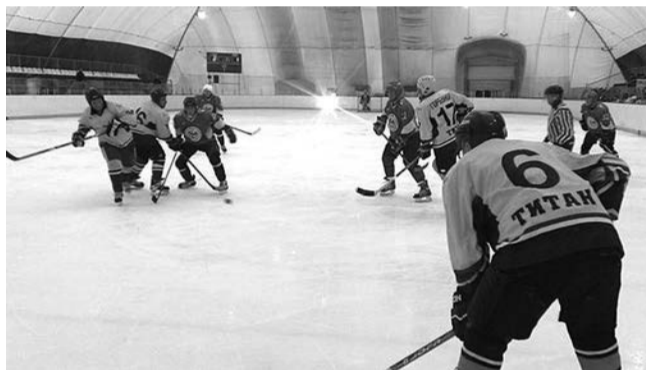
фрагмент решающего матча между "Стартом" и "Кедром"

В решающем матче турнира наша команда обыграла новоуральцев со счётом 6:2 и забрала главный приз домашнего турнира. В матче за третье место «Факел» добился победы над «Спутником» и вступил на пьедестал почёта.