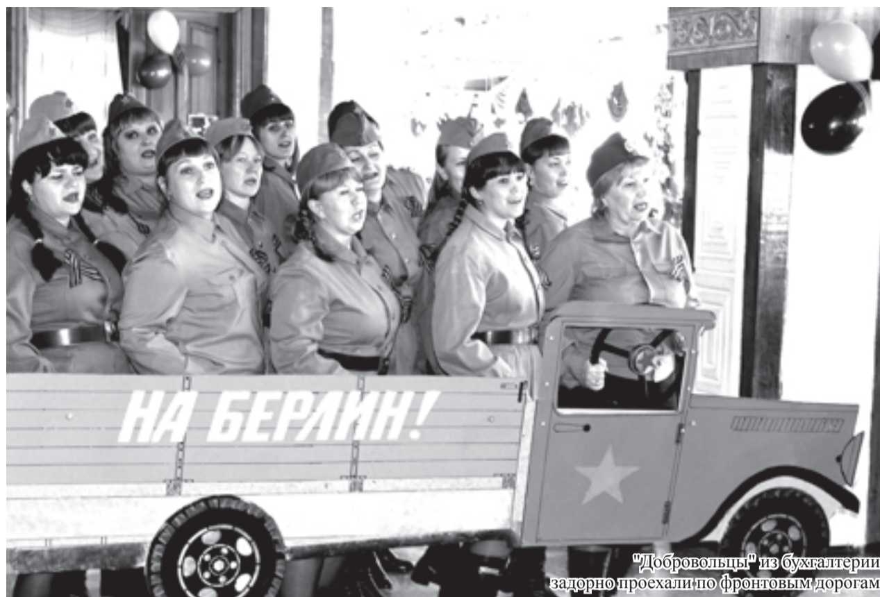
"Добровольцы" из бухгалтерии задорно проехали по фронтовым дорогам