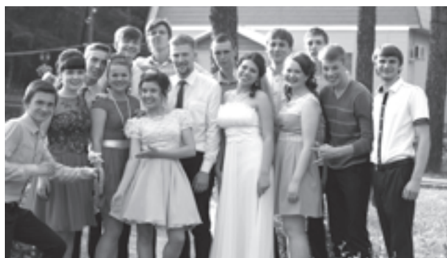
11 класс, школа № 2