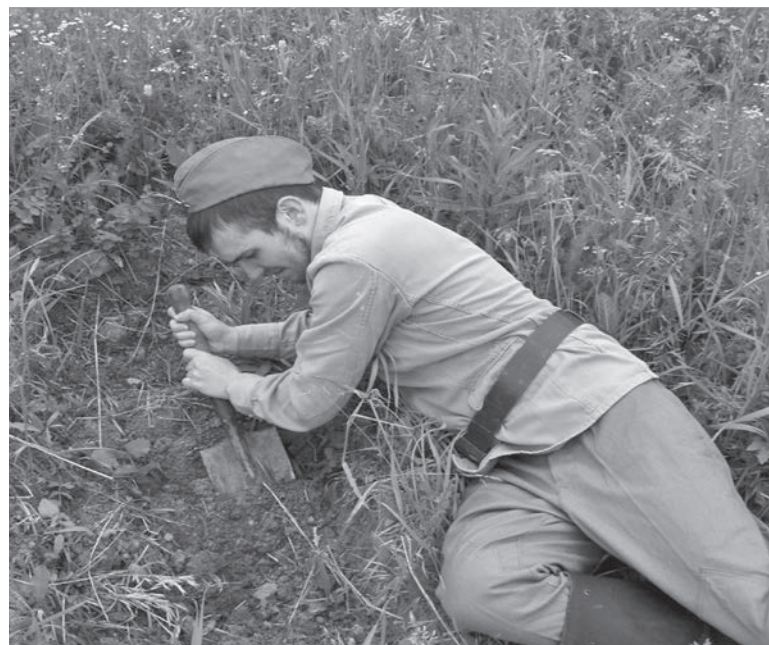
В реальном бою навыки отрывки окопа пригодятся

В целом цели и задачи, которые были поставлены перед началом сборов, достигнуты. Юноши техникума смогли получить те первоначальные навыки, которые им будут необходимы при