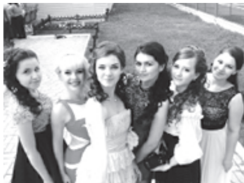
Выпускницы школы № 14