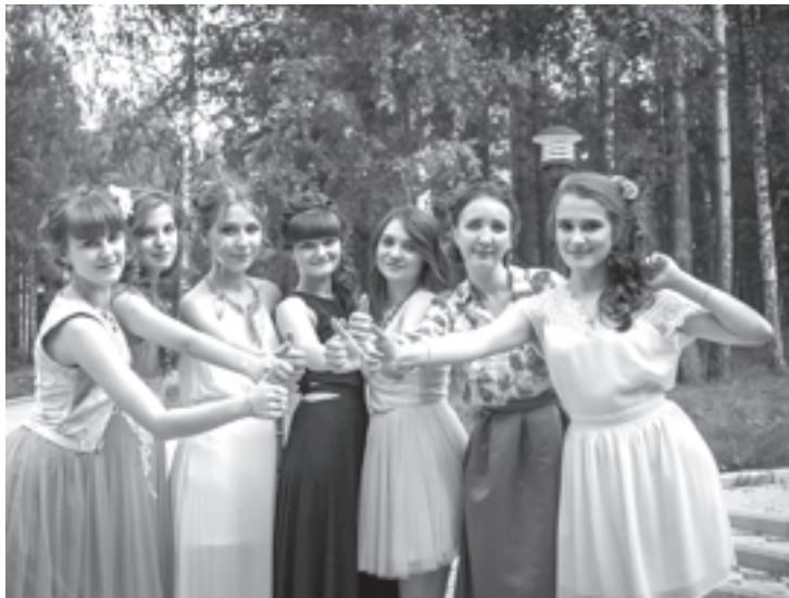
11 класс, гимназия