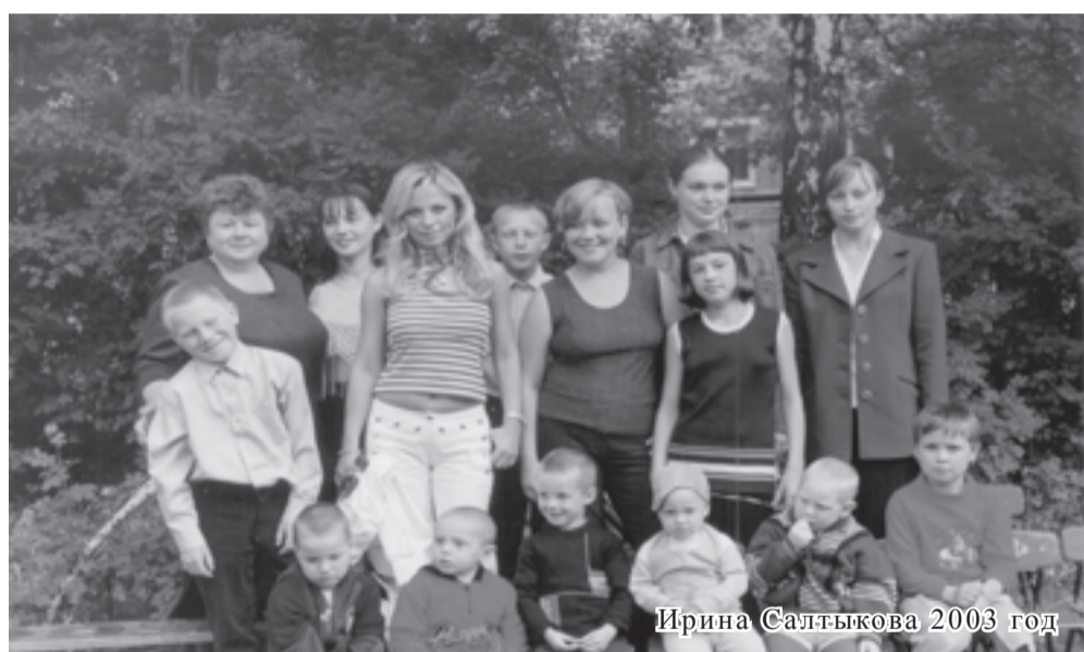
Ирина Салтыкова 2003 год