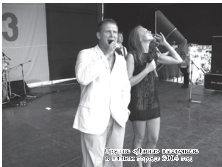
Группа «Дюна» выступала в нашем городе 2004 год

Предлагаем вашему вниманию фото разных лет. Некоторым фотографиям уже 15 лет, есть и более поздние. А после нынешнего празднования юбилея города, которое состоится 17 и 18 июля 2015 года, сравним архивные фотографии со свежими. Будет интересно и познавательно!