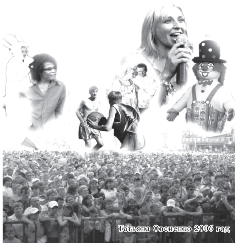
Татьяна Овсиенко 2006 год