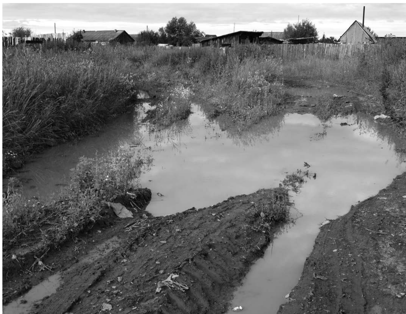
Г.Нижняя Салда ул. Механизаторов

В редакцию газеты обратились работники «Скорой помощи» с вопросом «Как быть и что делать, ведь к домам на некоторых улицах в 1-ом отделении совхоза просто невозможно подъехать?»