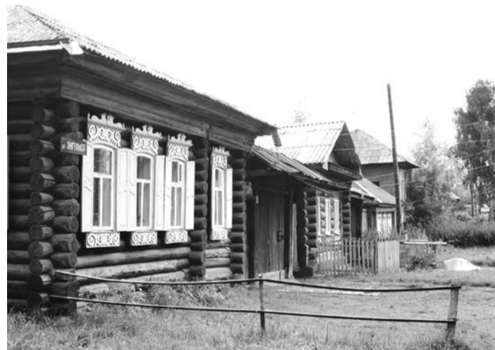
ул. Энгельса, Нижняя Салда

Мне кажется, все зависит от мироощущения. Если хочется создать из своего дома непреступную крепость – забор надо выбирать покрепче (и вообще – возвести китайскую стену). Если без затей обозначить свою территорию – достаточно сетки или сделать забор деревянным.