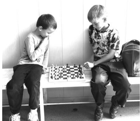
Интеллектуальные игры в перерывах между тренировками

В детско-юношеской спортивной школе Нижней Салды воспитывают великих футболистов и хоккеистов