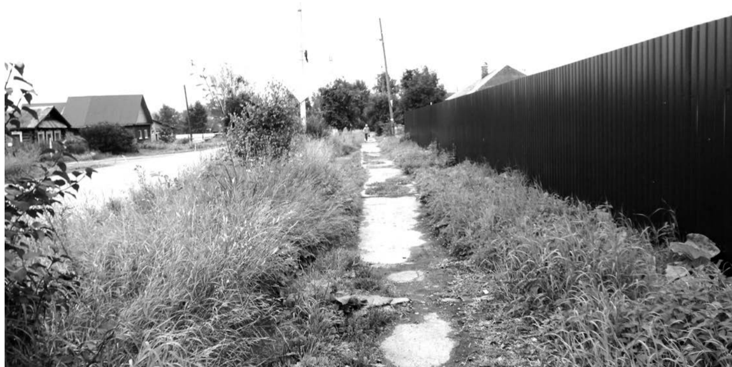
ул. Раб. Молодежи, Верхняя Салда

Внешний облик Верхней Салды меняется, и не всегда в лучшую сторону. Нажитое непосильным трудом горожане скрывают за высокими заборами