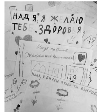
Ребята из 3Е класса школы написали пожелания для Нади - 26 красочных листов с трогательными пожеланиями и рисунками. Родители в классе собрали 10 тысяч рублей для Детского хосписа.