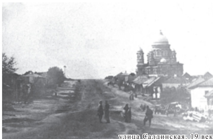
улица Салдинская, 19 век