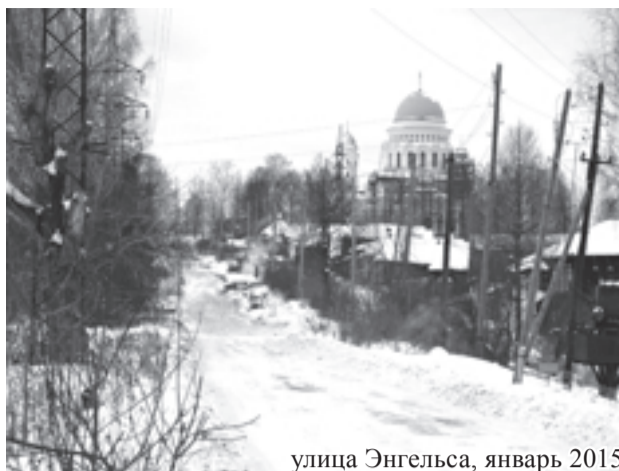
улица Энгельса, январь 2015