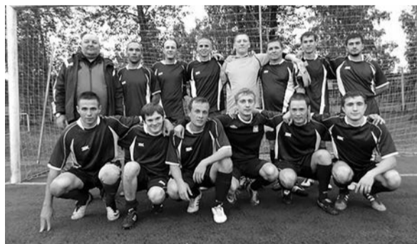
На фото: Команда «Металлург» в сезоне 2015 года

Летний футбольный сезон подошел к концу. До новых встреч уже в следующем футбольном сезоне. Будем надеяться, что в будущем наша команда выступит более удачно и сможет побороться за более высокие места.