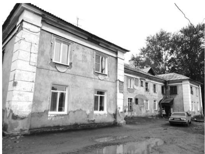
ул. Крупской, 27, Верхняя Салда

В предыдущих номерах «Салдинского рабочего» мы сообщали, что жители дома № 27 на улице Крупской в Верхней Салде направили в администрацию обращение о признании дома аварийным. В пятницу, 25-го, дом осмотрела комиссия по оценке жилых помещений муниципального жилищного фонда.