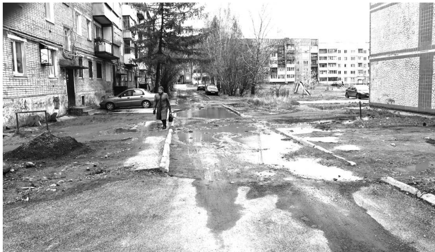
Тротуар у дома № 15 по ул. Ломоносова в Нижней Салде