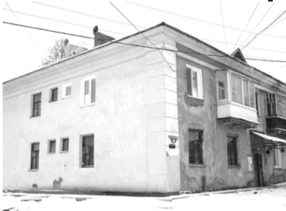
Погоды хватило только на фасад. Верхняя Салда, ул. Евстигнеева, 26