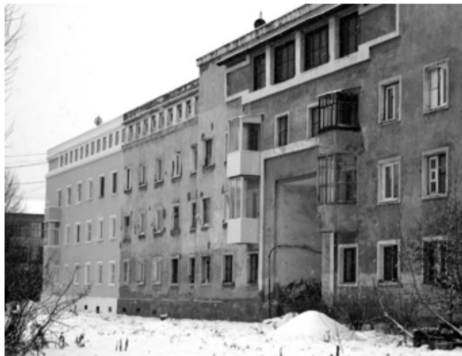
Тоже не успели докрасить. Верхняя Салда, ул. К. Либкнехта, 12

Под таким громким заголовком в начале октября (через два дня, как снег накрыл территорию и стало ясно, что случилась зима) вышла статья в «Областной газете». В ней сообщался безрадостный факт: В Свердловской области подрядные организации провели капитальный ремонт только 30 домов из 961 запланированного.