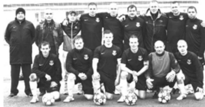
Команда "Титан", Верхняя Салда

Верхнесалдинский «Титан» перед последним туром чемпионата области по футболу второй группы имел неплохие шансы для завоевания бронзовых медалей чемпионата. Заключительная игра для титановцев проходила в городе Двуреченск с основным конкурентом в борьбе за третье место в турнирной таблице. Салдинцы перед очной встречей опережали соперника на 2 очка, тем самым наших футболистов устраивала и ничья в данной встрече.