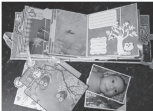
Альбом для малыша "Совенок"