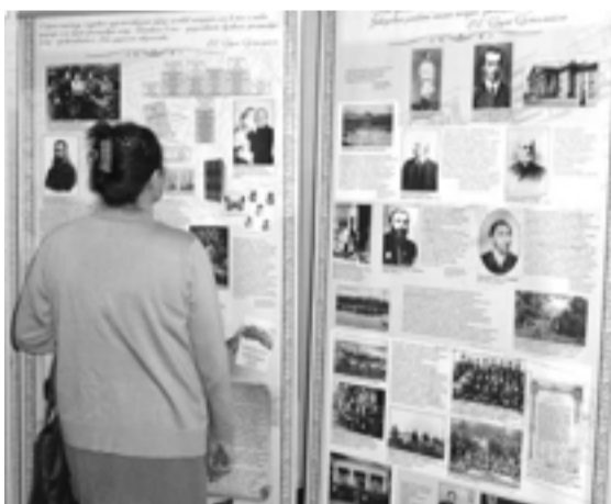
Передвижная выставка «Пример служения Отечеству»