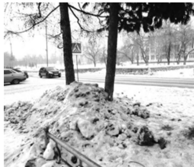
С кедром тоже не проихнулись