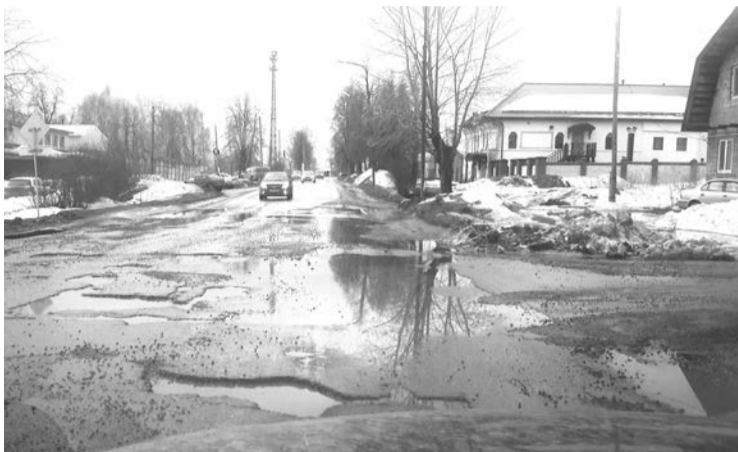
Верхняя Салда, ул. Ленина