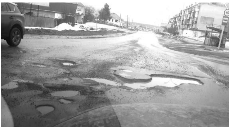
Верхняя Салда, ул. Молодежный поселок