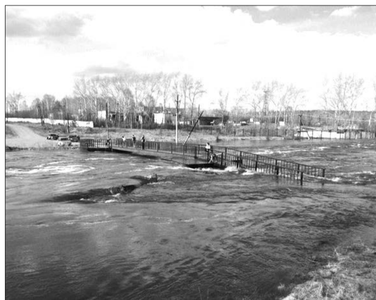
Верхняя Салда. Мостик, ведущий к горе Мельничная