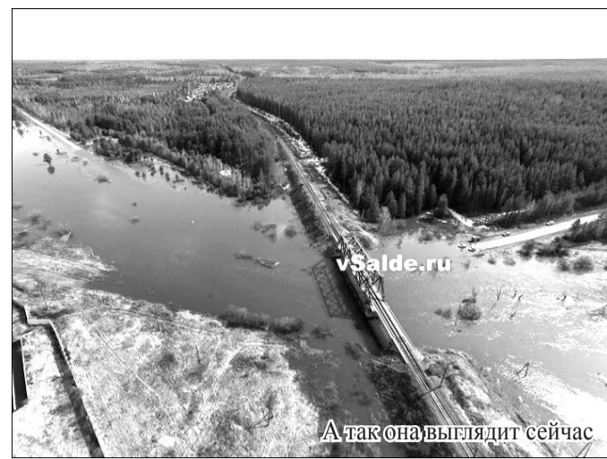
А так она выглядит сейчас