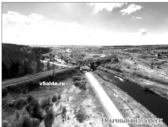
Обычный вид дороги