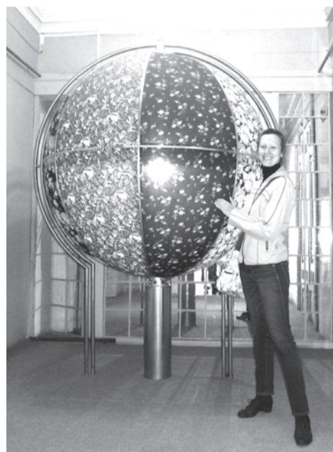
Глобус из ивановского ситца

модель от этого всемирно известного модельера — свадебное платье цвета шампань, символически подаренное музею Иванова — «города невест». В музее работают его постоянные выставки: «Слава — городу невест», «От рубахи с сарафаном до кутюр от Зайцева». До 1932 года город назывался Иваново-Вознесенском. Он был образован слиянием существовавшего с XV века села Иваново и появившегося в XIX веке Вознесенского посада.