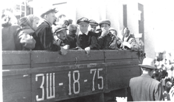
Отъезд детей в пионерлагерь от Дворца культуры. Верхняя Салда, конец 1950-х годов