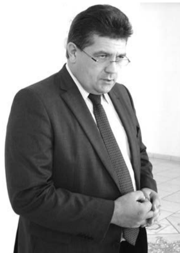
На прошлой неделе Нижнюю Салду посетил министр социальной политики Свердловской области Андрей Злоказов

Наша газета поинтересовалась у Андрея Владимировича, повлияла ли кризисная ситуация в экономике на финансирование социальных программ.