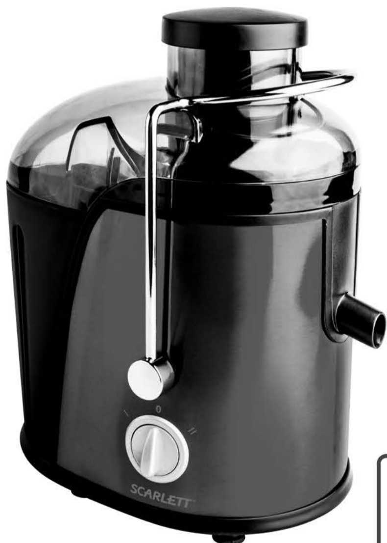
SC-JE 50 S 16