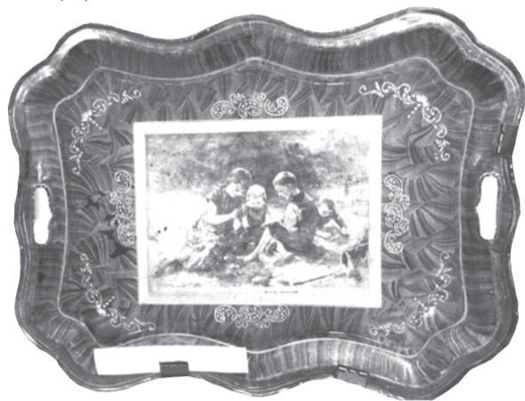
Поднос с переводной картинкой "Беззаботное детство", ручная ковка, 1902 год

Долгожданным событием стало открытие выставки «Тагильский поднос», которое состоялось 14 сентября в Верхнесалдинском краеведческом музее.