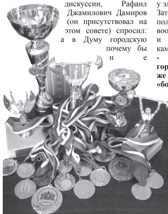
Награды Лены Федотовой