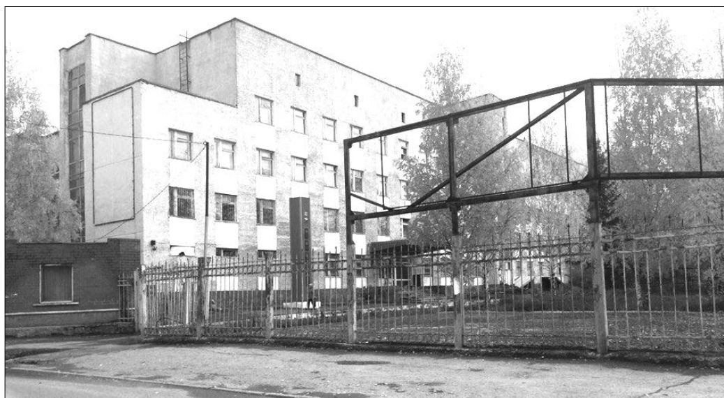
Какая судьба ждет бывший военный госпиталь в Верхней Салде?