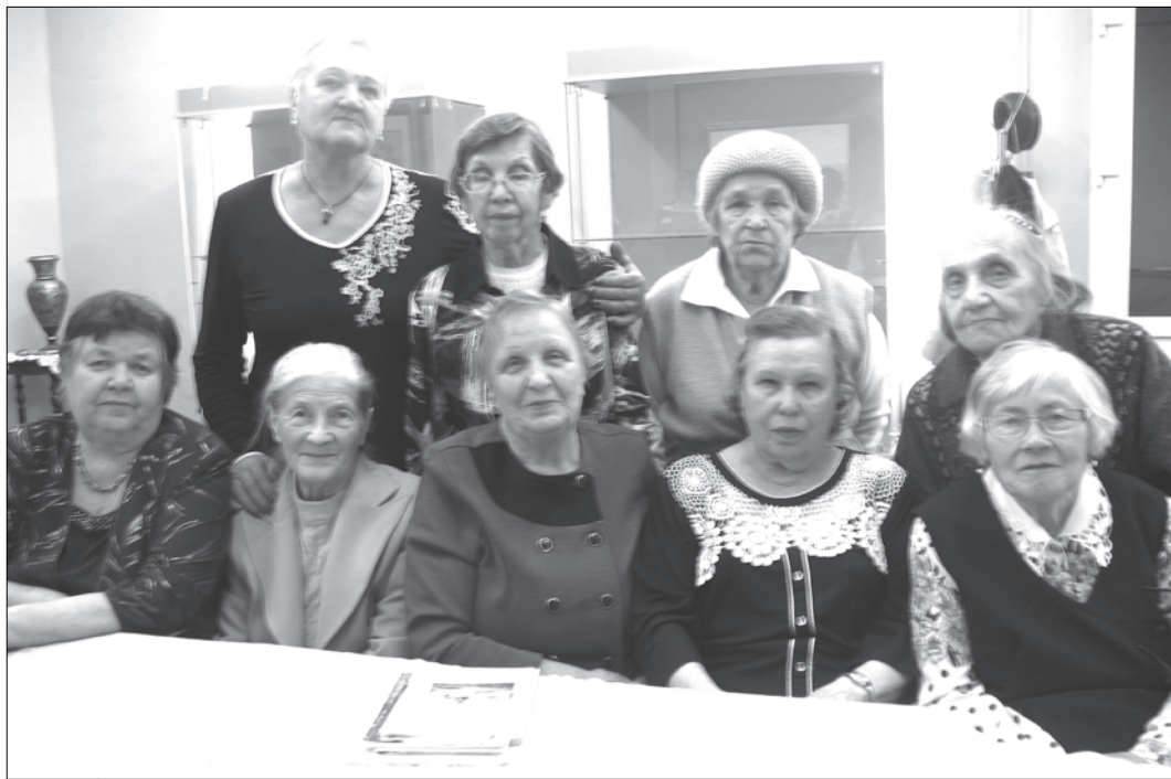
На этой фотографии – лица наших дорогих учителей. 29 сентября они собрались на осенний педсовет в Краеведческом музее Нижней Салды. Им по восемьдесят и более лет, а за спиной у них – педагогический стаж до полувека

В своем приветствии первому учительскому съезду в январе 1925 года В.В.Маяковский писал: