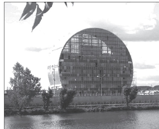
Инновационный культурный центр в Первоуральске, где проходил Форум урбанистики

В частности, обсуждалось, как сугубо промышленный населённый пункт превратить в город, удобный для жизни и бизнеса, каким должны быть его улицы, транспорт и общественные места.