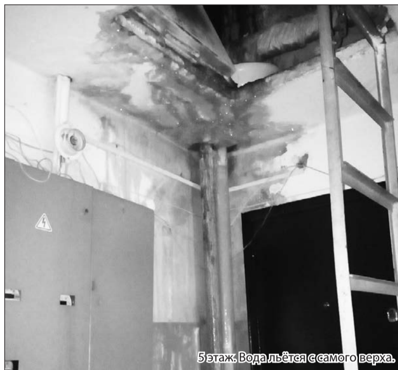
5 этаж. Вода льётся с самого верха.

А первого июля 2016 года (в день повышения тарифа) УК отписала: сведения раскрытию не подлежат. «Это шедевр! – восклицают жители. – А ведь мы, на секундочку, платим вам зарплату». (Из платы жильцов за содержание жилья