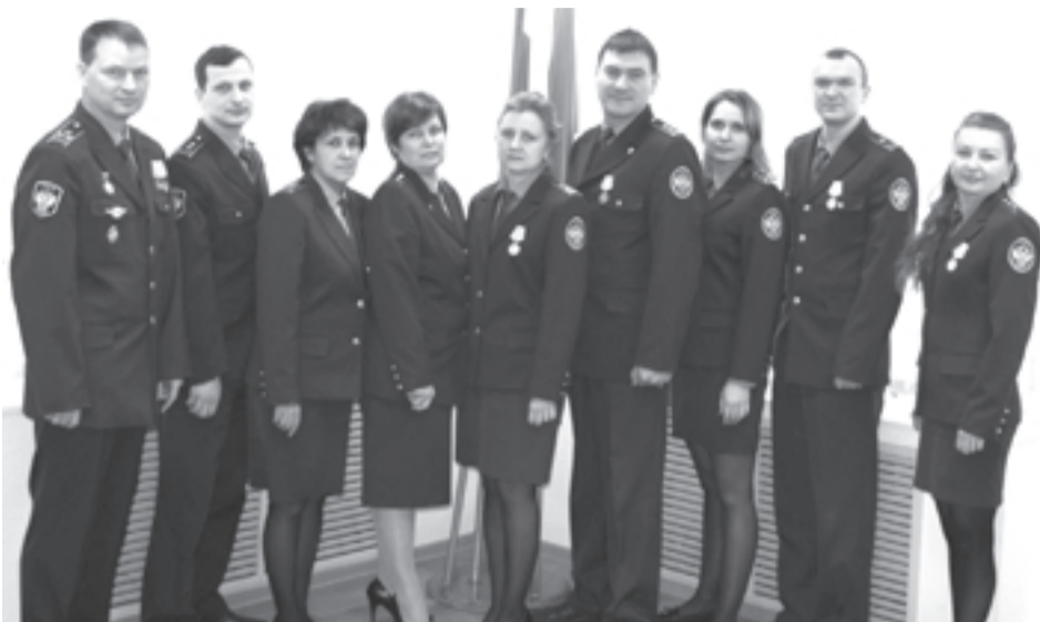
Личный состав поста

Таможенный пост расположен в г. Верхняя Салда по адресу: ул. Северный поселок, 14, корп. 1