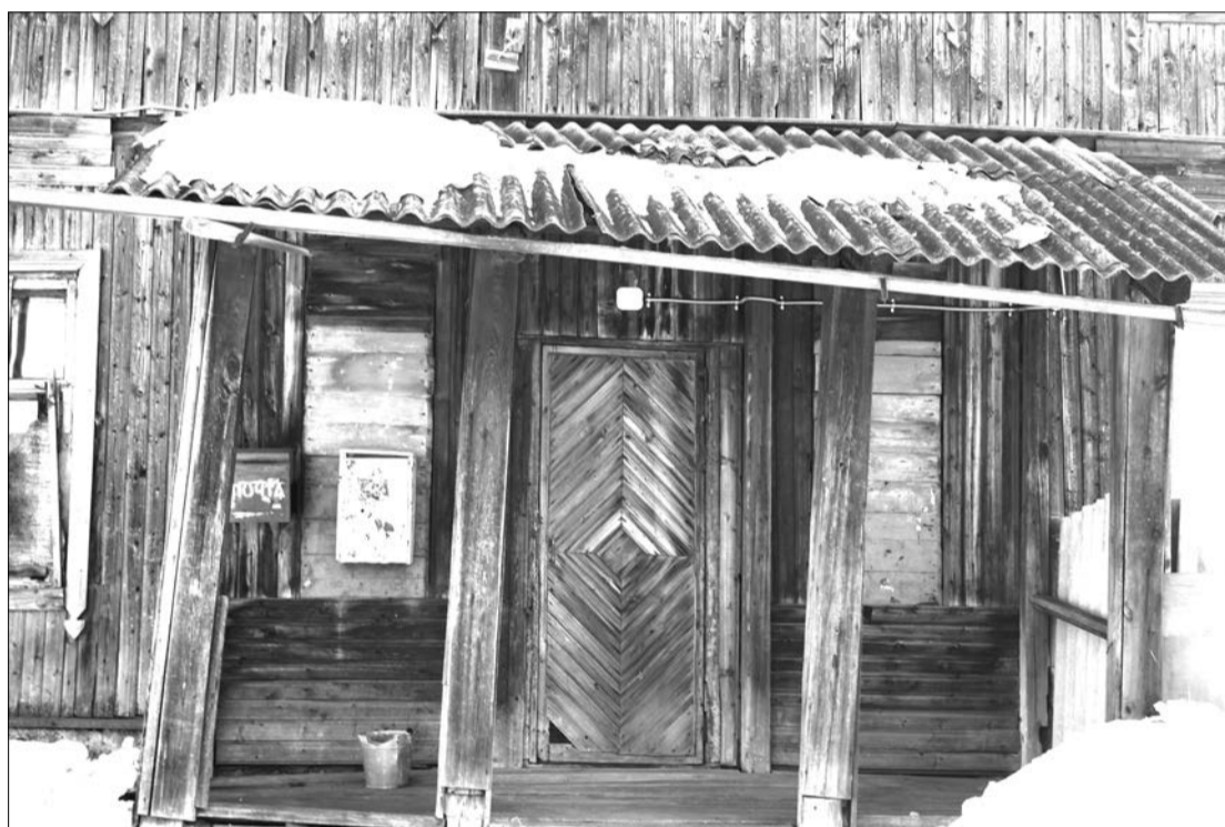
Косые стойки и треснувшая черепица в подъезде, дом 156, ул. Раб. молодежи

Новость о сносе хрущевок в Москве – для москвичей наверняка будничная, а вот в провинции простые обыватели, пенсионеры, так и ахнули.