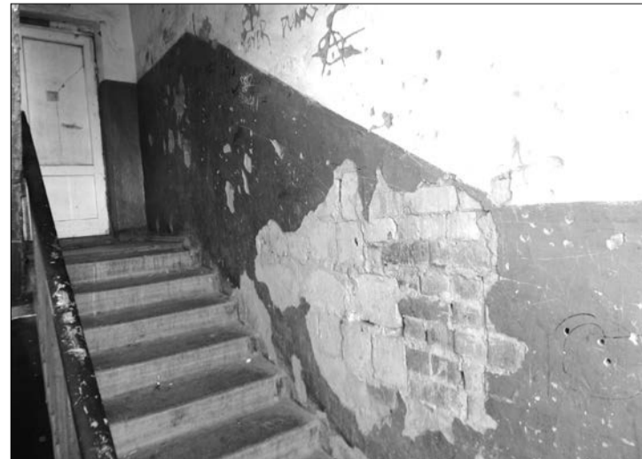
Один из подъездов в доме 137а на улице Фрунзе