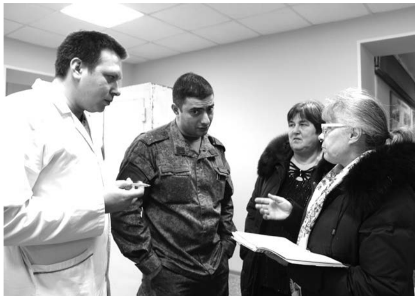
Комитет солдатских матерей из Салды приехал в поселок Свободный