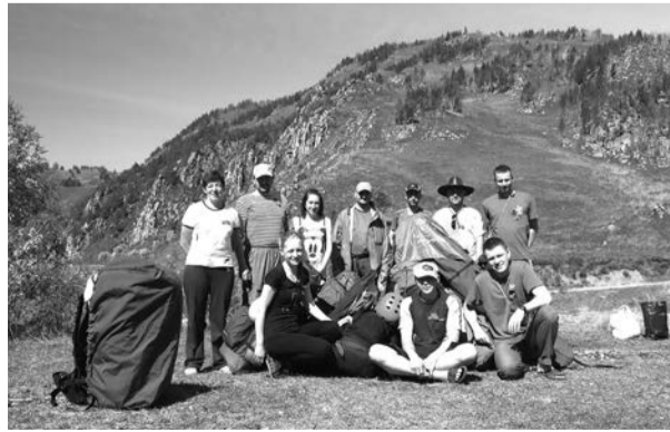
После сплава на реке Песчаной, 2015 год