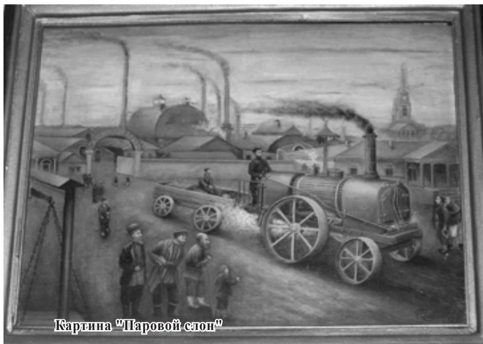
Картина «Паровой слон»