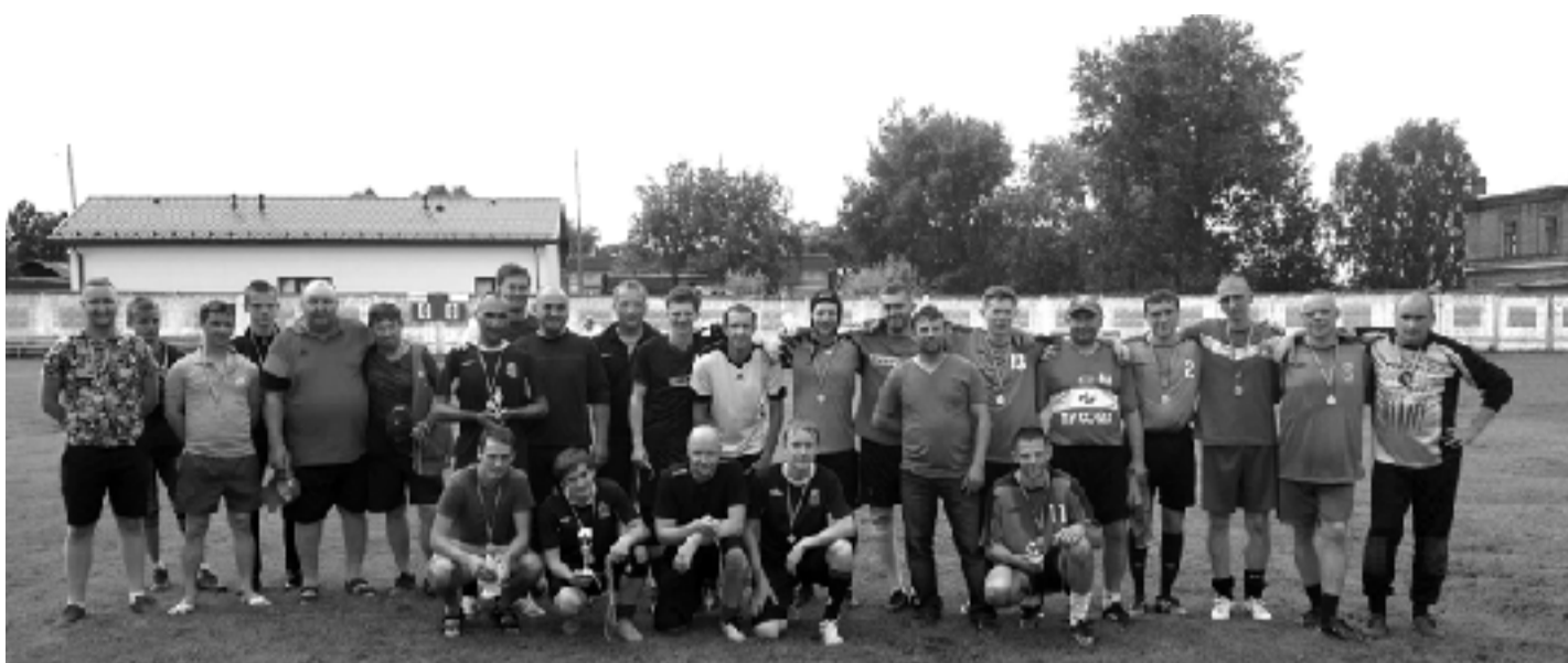
На снимке: Команды с призами после финала первенства города по футболу 2017 год