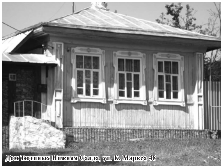
Дом Тютиных Нижняя Салда, ул. К. Маркса 48