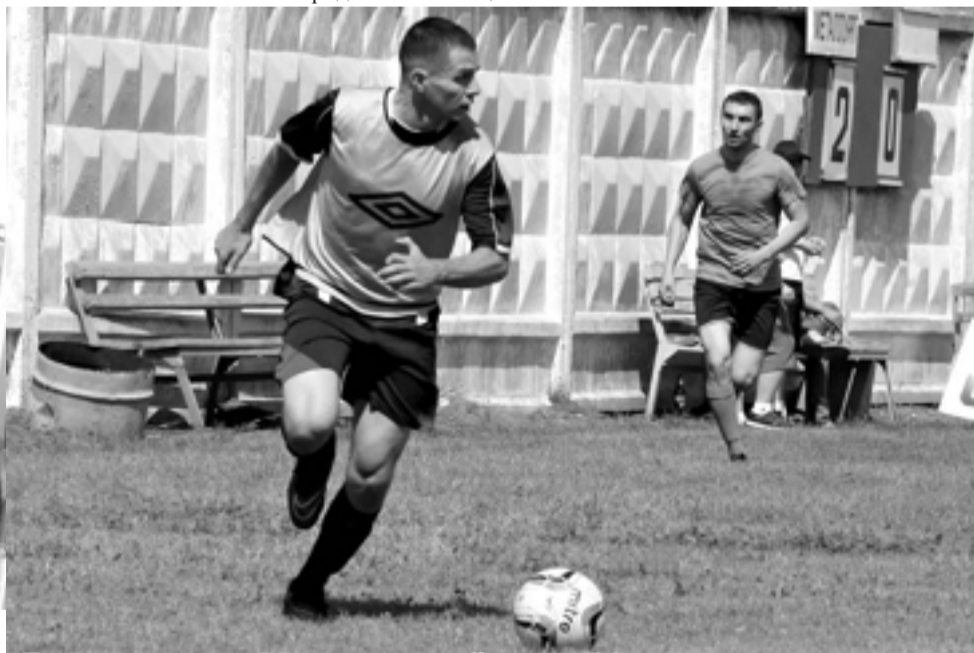
Фрагмент матча «Металлург» - «Спарта» 7:0