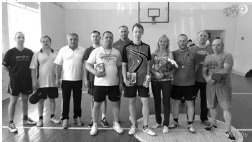
Участники турнира по настольному теннису