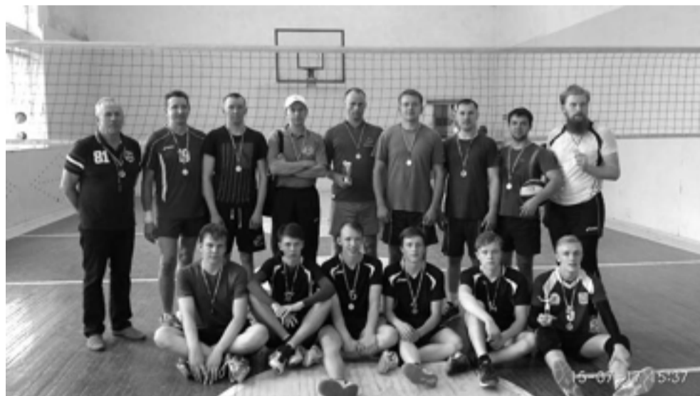
Участники волейбольного матча