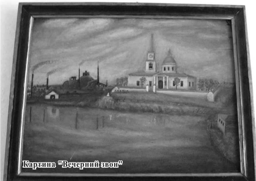
Картина «Вечерний звон»