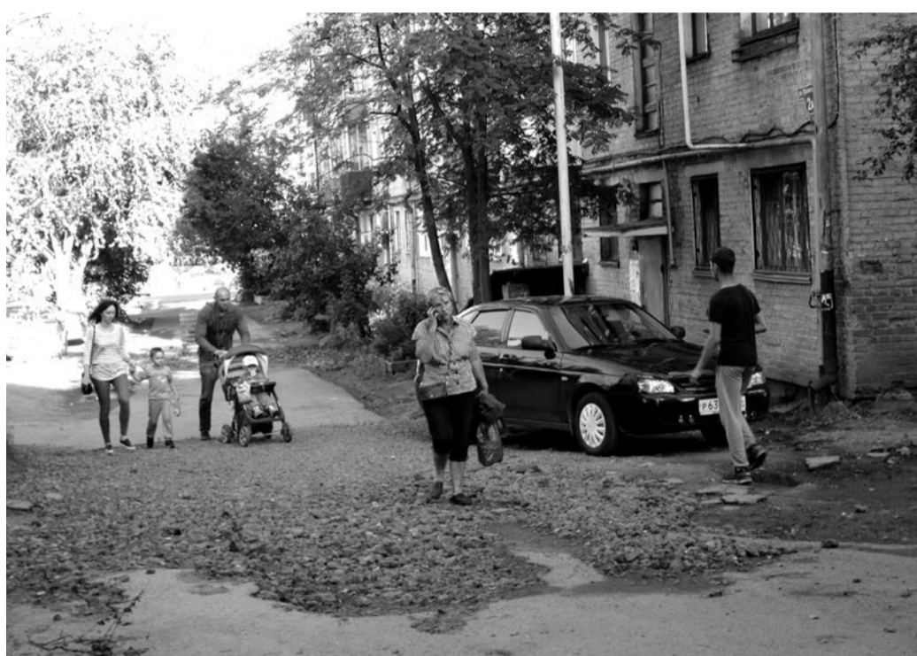
Засыпанная булыжниками яма на улице Пролетарской