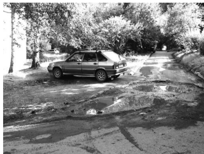
Поворот с улицы Пролетарской. Тут и ограждения ставить не надо, все равно не пройти-не проехать