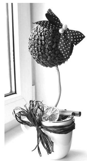
Поделки в технике "топиарий"