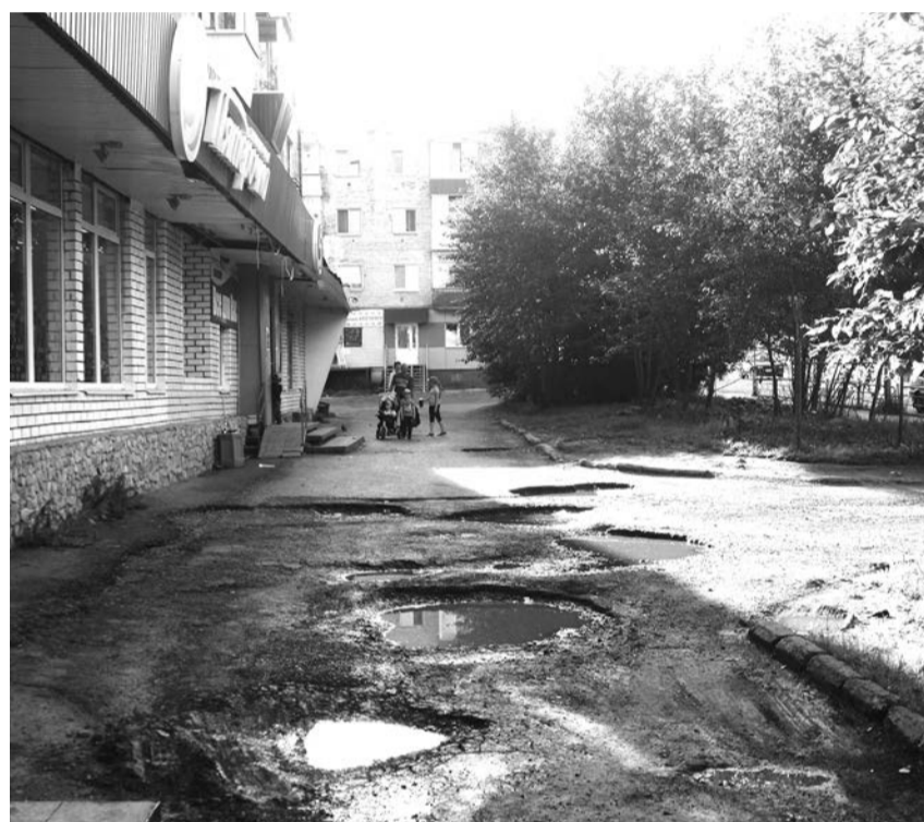
Возле магазина "Пятерочка" (бывшая "Мужская одежда")