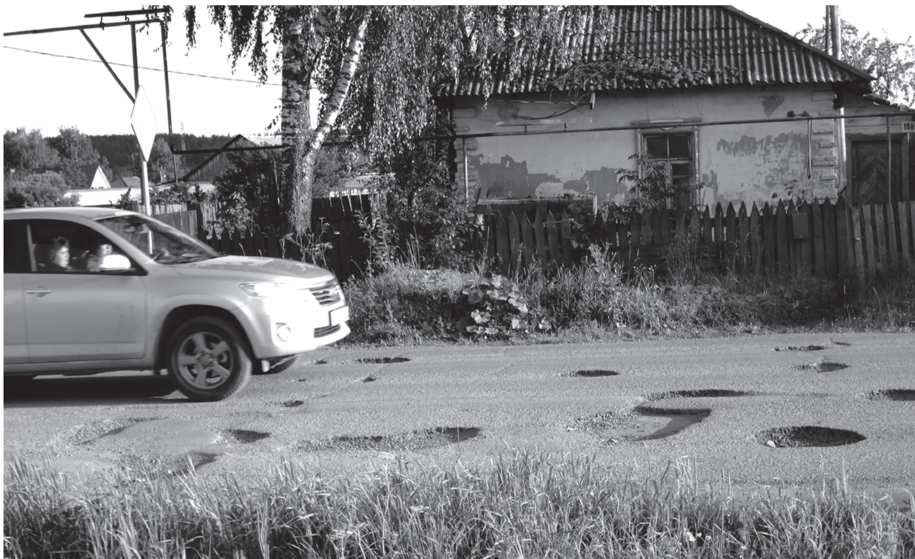
Улица Карла Маркса, Верхняя Салда

Давно поменялось отношение к революциям вообще и к мировой в частности, но в любом городе нашей многострадальной державы можно обнаружить улицы Ленина и Карла Маркса. Причем долго искать не придётся, как правило, это одни из главных. Вот и в наших Салдах таковые улицы имеются.