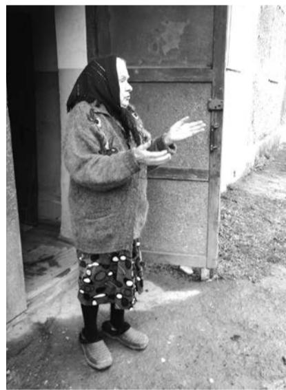
Баба Сима не знает, где теперь ей сушить белье. Сентябрь, 2016 год