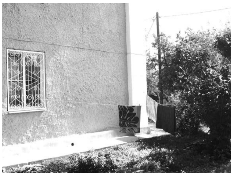
Вот так сейчас изобретается баба Сима закреплять веревки для сушки белья. Август 2017 год

Год назад приняли в эксплуатацию школу № 1 в Верхней Салде.