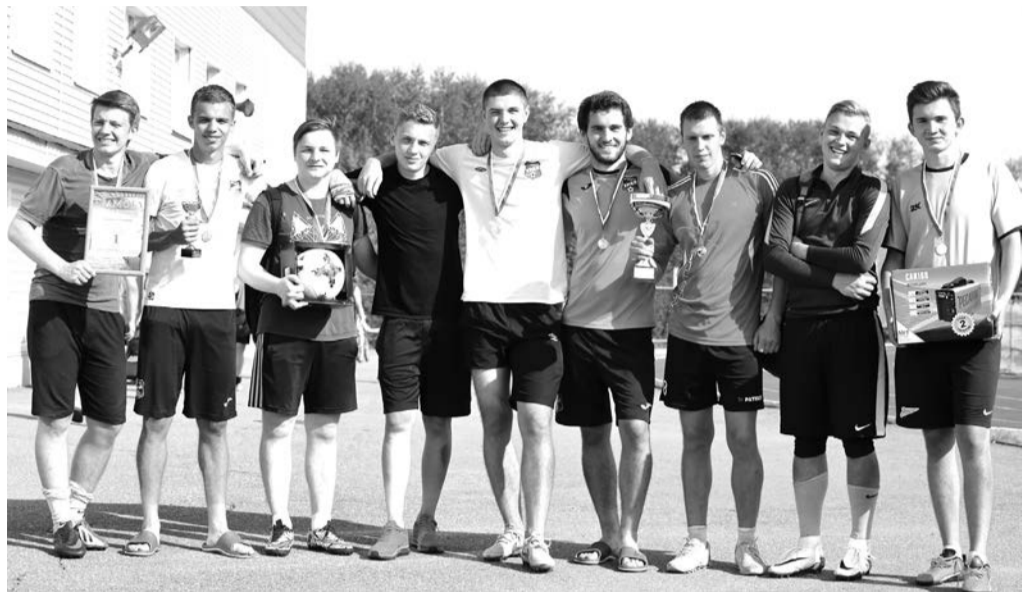
Команда "Янг Бойз" с кубком Магнита

В минувшую субботу прошёл традиционный, уже 11-й по счёту, турнир по футболу среди любительских футбольных команд. Соревнование было приурочено к Дню города Верхняя Салда.