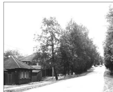
Улица Краля Маркса в Нижней Салде ждет газа

стабильное и достаточное освещение всех улиц городского округа Нижняя Салда и содержание дорог ГО Нижняя Салда в