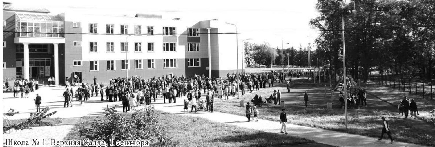
Школа № 1. Верхняя Салда, 1 сентября

Школы Салды вновь наполнились детскими голосами.