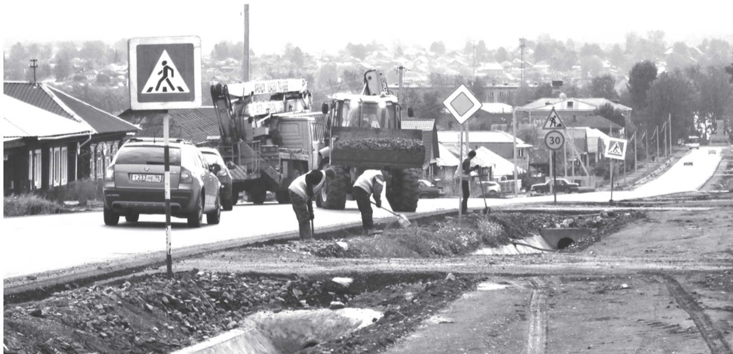
Работы на улице Фрунзе в Нижней Салде. 6 сентября 2017 г.

Улица Фрунзе в Нижней Салде преобразуется буквально на глазах, чего не скажешь об улице Ломоносова.