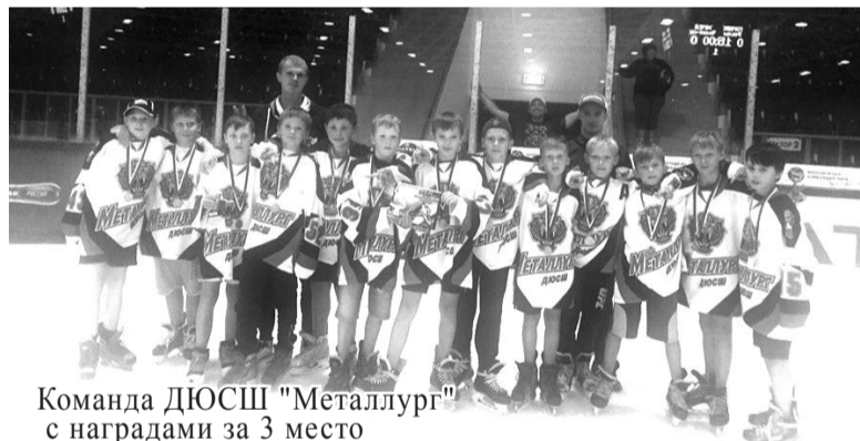
Команда ДЮСШ "Металлург" с наградами за 3 место