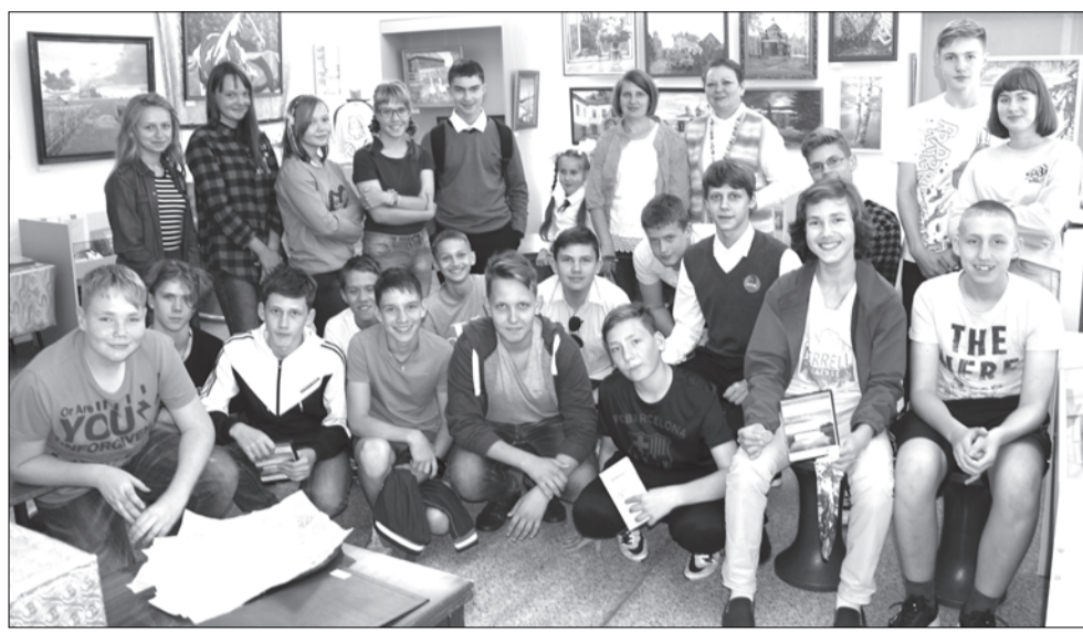
8А класс, школа № 1, на новой выставке в краеведческом музее Верхней Салды