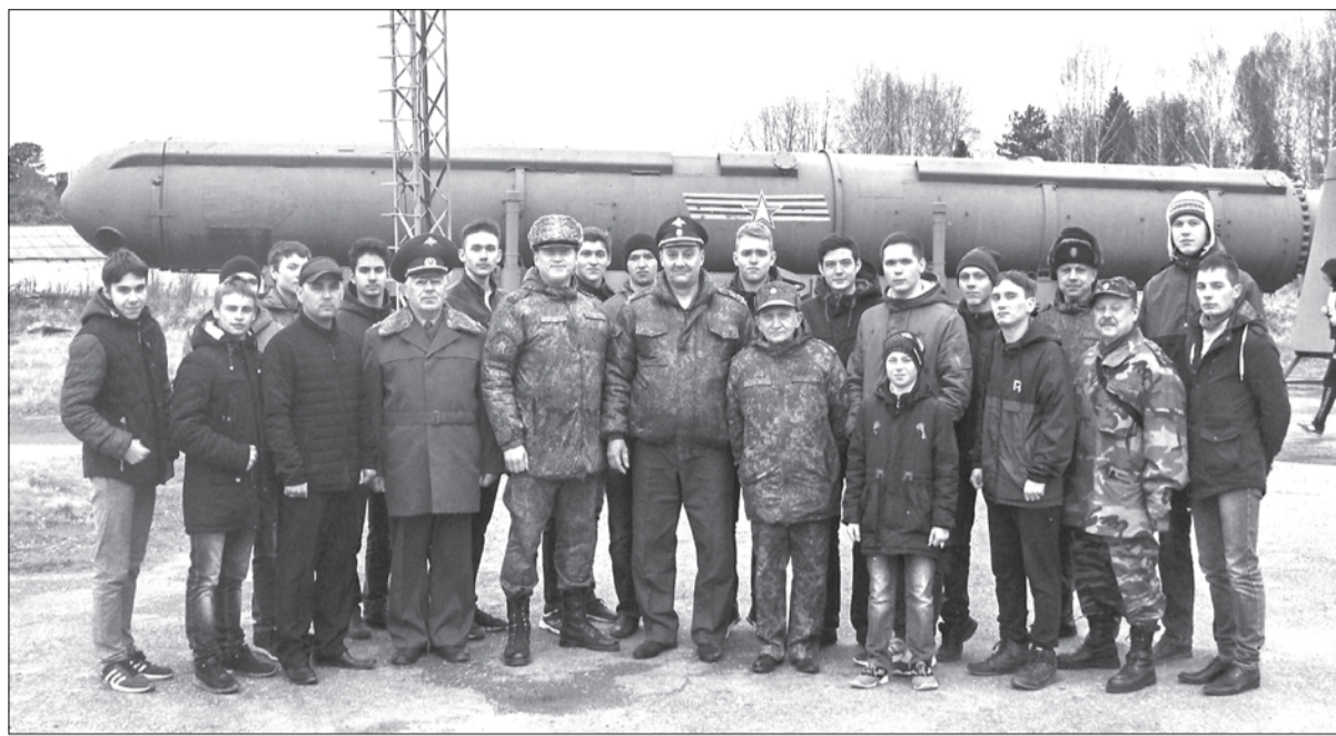
Учащиеся техникума в ракетном соединении

Недавно в Верхней Салде прошёл День призывника