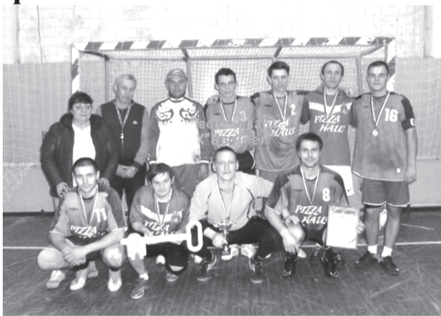
Победители турнира команда «Бордо»

В октябре в СК «Вымпел» прошёл турнир по мини-футболу, приуроченный к 50-летию спорткомплекса. Сколько соревнований видел «Вымпел» за столько лет существования! Это знаковое место для всех салдинских спортсменов.