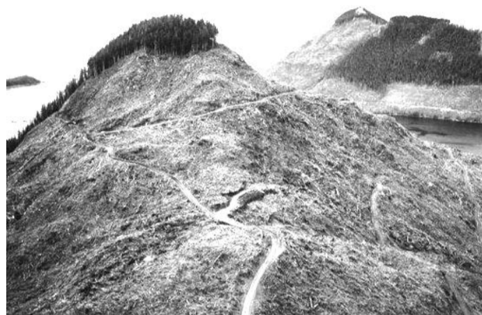
Таежные сопки становятся лысыми

Лиза Никифорова, ученица 6Б класса верхнесалдинской школы № 1, нарисовала плакат для конкурса «Сохранить будущее планеты».