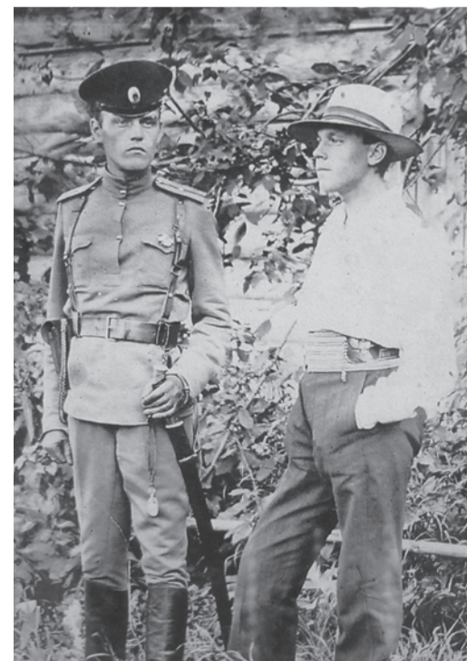
Братья Дьячковы. Один - за белых, другой - за красных. Верхняя Салда, 1918 год