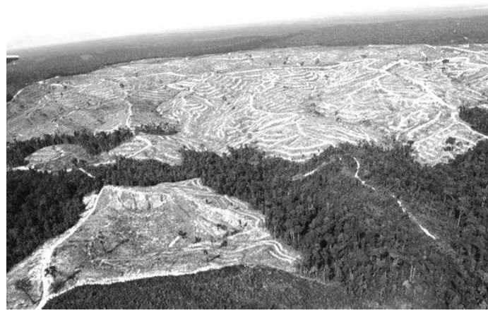
Это не степь. Это тайга после "набега" соседей