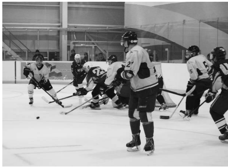
Фрагмент матча Энергия - Титан

Внезапно защитник рефтинцев заряжает от синей линии,