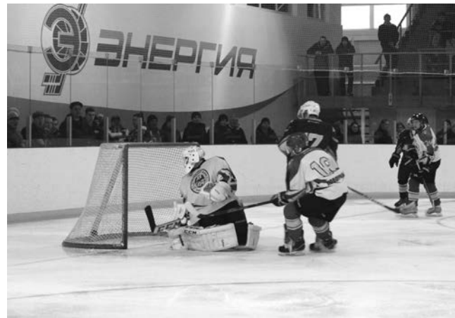
"Энергия" отправляет очередную шайбу в ворота "Кедра"

«Плей-офф» ½ финала «Кедр» Новоуральск- «Энергия» п. Рефтинский 5:4 (ОТ), 1:8 «Урал» Ирбит – «Металлург» Двуреченск 2:4, 4:3 (ОТ)