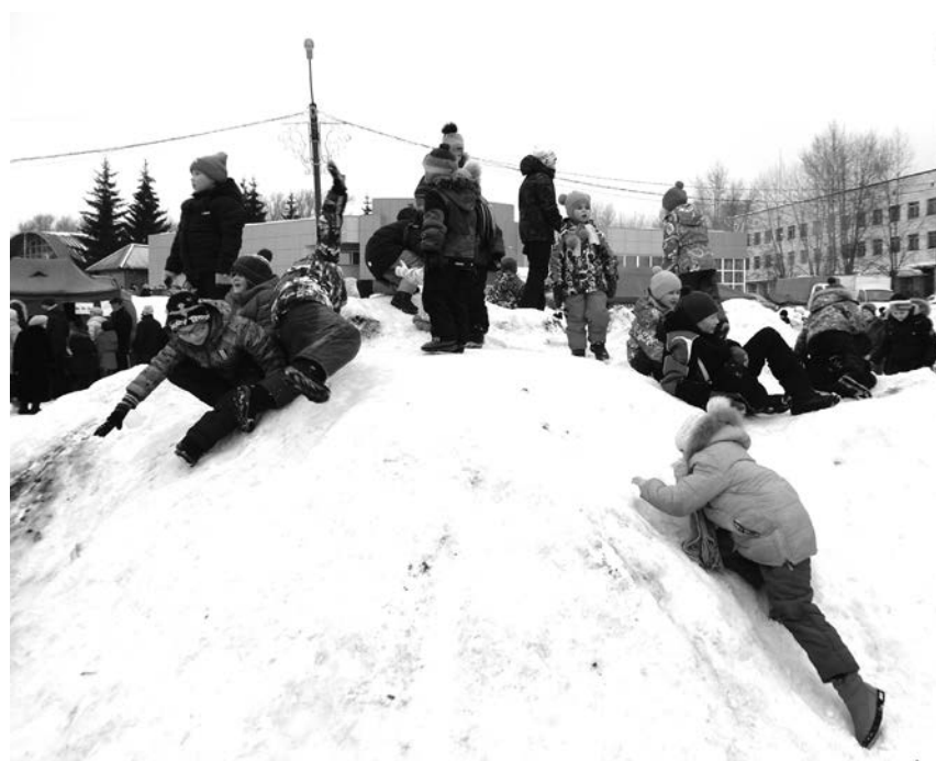
Празднование Масленицы в деревне Северная и в Верхней Салде