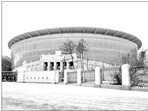
Обновленный стадион «Центральный», Екатеринбург

Эта встреча для «Урала» стала последней на «СКБ - Банк Арена». Уже после выездной встречи в Хабаровске (уральские футболисты на выезде разгромили хозяев 3:0) футболисты нашей команды переедут на