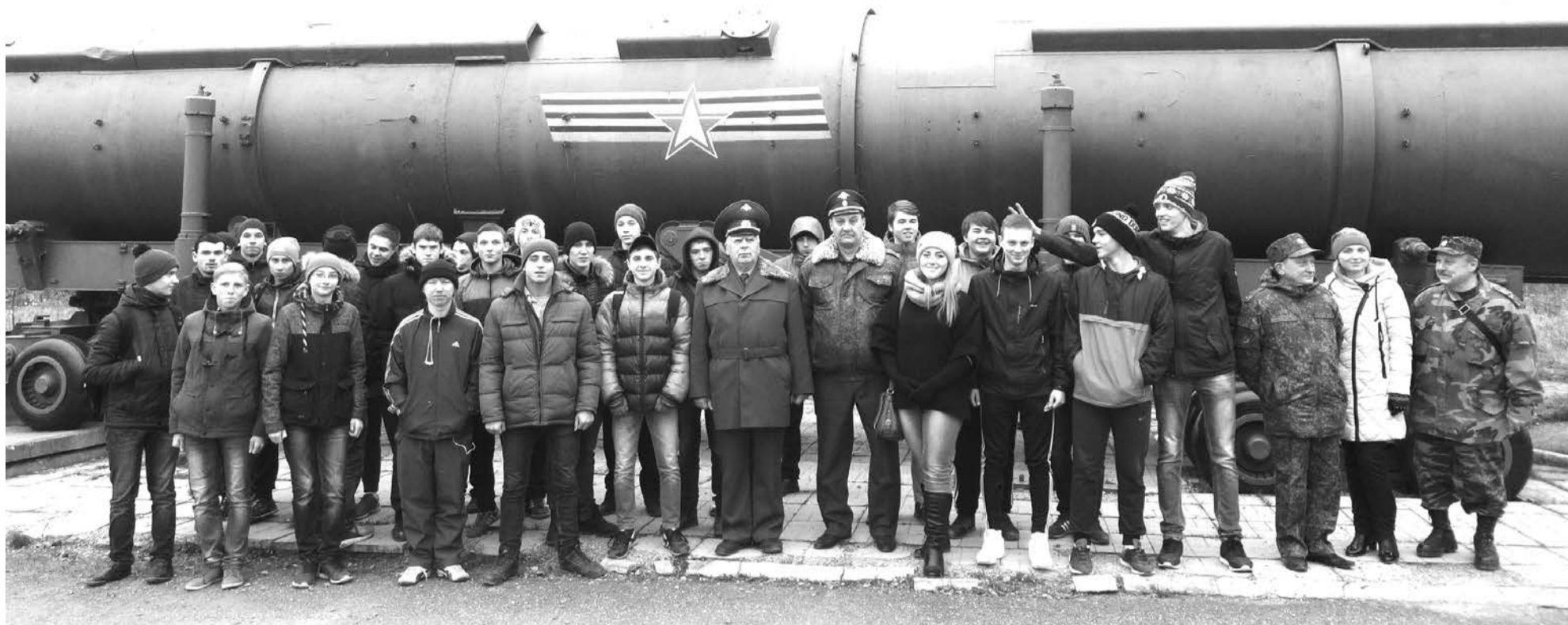
День призывника в ракетной дивизии, дислоцированной в посёлке Свободный