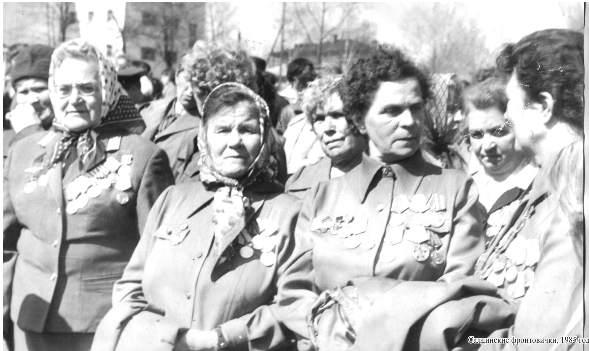
Салдинские фронтовички, 1985 год