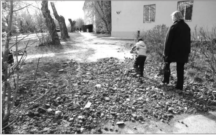
Пешеходная дорожка за домом № 5 по ул. Рабочей молодежи в Верхней Салде