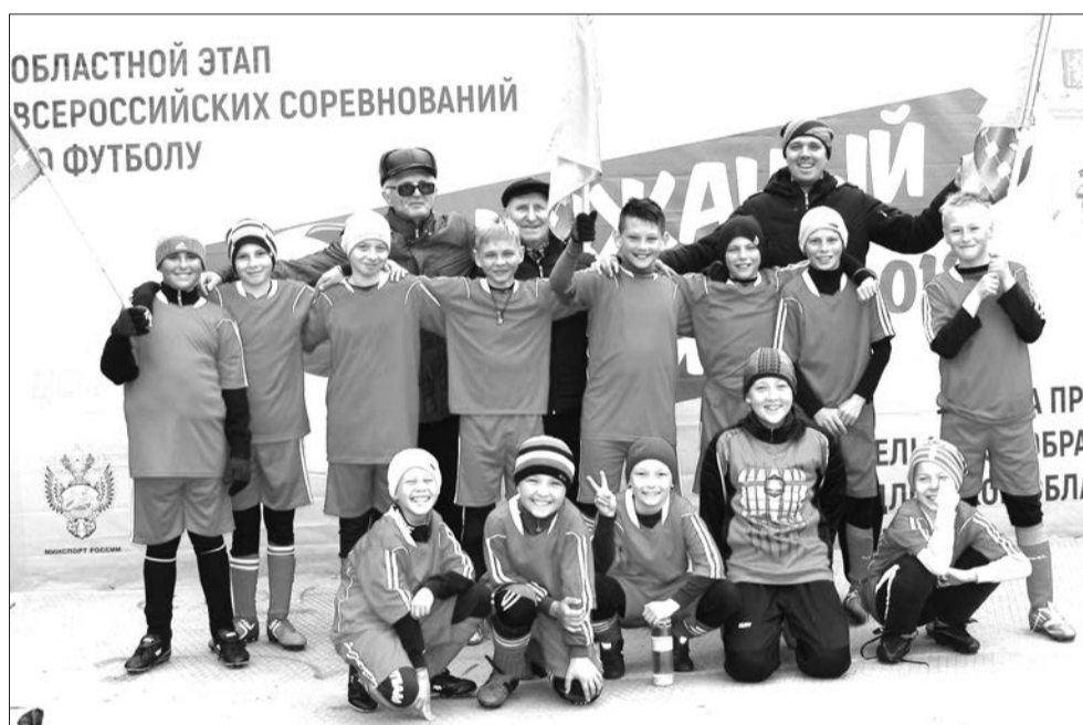
Команда "Металлург" на турнире "Кожаный мяч" в Верхней Сиячихе

Но сохранить ворота в неприкосновенности до перерыва наши футболисты не сумели, гости довольно