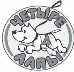
Фото ПАРАД любимцев