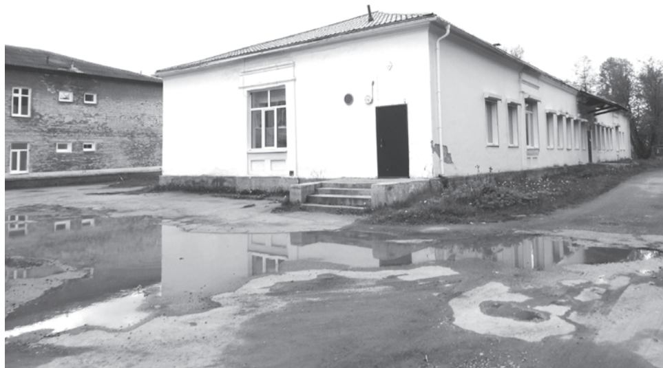
Здание бывшего детского реабилитационного центра. Сейчас здесь инфекционное отделение Центральной городской больницы. Его чистенький отремонтированный фасад так контрастирует с обшарпанными стенами детской больницы (слева)!

А сколько разрушено медицинских учреждений за годы «оптимизации»? На форумах врачей сообществ в