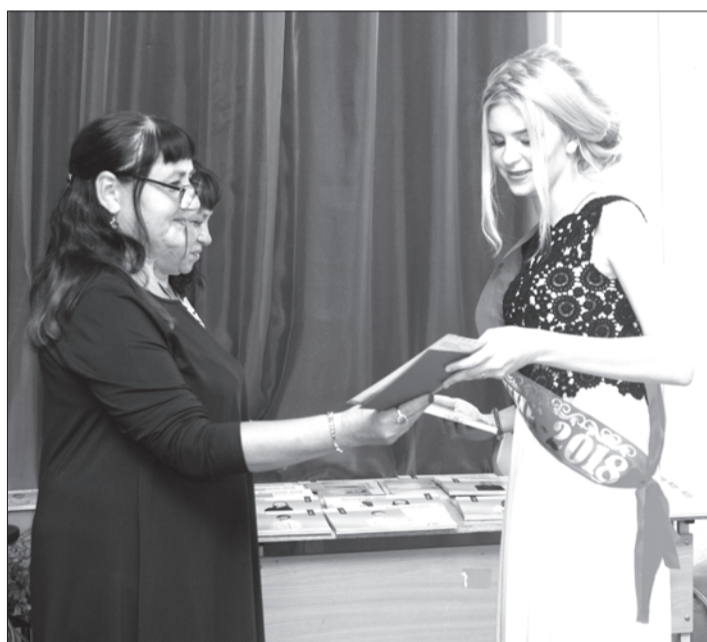
Вручение аттестата ученице школы 10