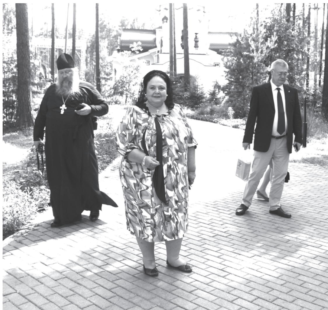
Великая княгиня Мария Владимировна. Ганина яма, июль 2018