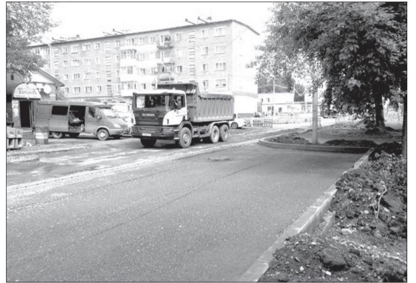
И все же улица Ломоносова асфальтируется!

4. Закрыли проезд по улице Ломоносова на 50%. Машины летят